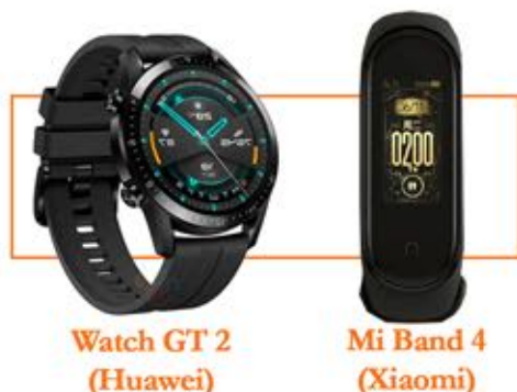
Watch GT 2 (Huawei)

Tak mau kalah, Xiaomi juga bakal meluncurkan penerus Mi Band 4. Sejumlah peningkatan dibawa, salah satunya NFC. Fitur NFC memang sudah lama tersedia di Mi Band, hanya saja penggunaannya hanya terbatas di China. Nah pada Mi Band 5 kemampuannya diperluas secara global. (ist)