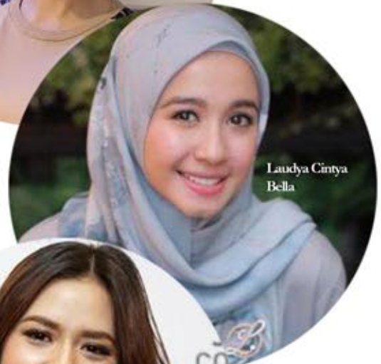
Laudya Cintya Bella