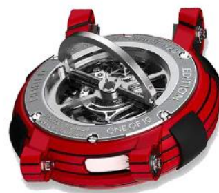
Jam Tangan RJ X Marvel Spiderman (RJ)

Jam tangan RJ X Marvel Spiderman(RJ) Selain itu, tampak ada mata topeng Spider-Man di dial dalam warna hitam, tali poliamida hitam yang meniru tekstur kostum superhero, plus kotak bertema laba-laba kayu hitam. Iterasi merah dibuat dari karbon hitam dan fiberglass