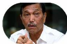
Menko Kemaritiman dan Investasi Luhut Binsar Panjaitan

"BUMN sekarang kan memang sudah diisi profesional, tidak masalah. Saya tak sebut nama tapi saya bicara mengenai seorang profesional yang masuk BUMN."