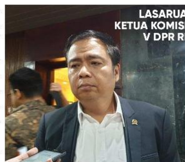
LASARUA KETUA KOMISI V DPR RI

"Kita cari jalan, tentu tidak mudah. Karena UU tentunya tak boleh sembarangan. Butuh diskusi, masukan. DPR akan mencoba menangkap aspirasi