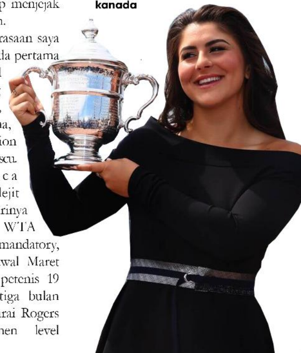
Bianca Andreescu Petenis asal Kanada

Nama Bianca Andreescu mulai melejit tiga bulan lalu sejak dirinya menjuarai turnamen WTA dengan level premier mandatory, Indian Wells 2019, awal Maret lalu. Kecemerlangan petenis 19 tahun ini berlanjut tiga bulan berselang saat menjuarai Rogers Cup 2019, turnamen level