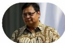
Menko Perekonomian Airlangga Hartarto

"Harapan kita memang Pak Ahok bisa bergabung bersama kita, satu di antara BUMN di Indonesia."