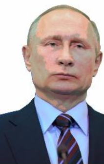
Vladimir Putin, Presiden Rusia

Mereka yang melawan korupsi harus bersih. Tidak punya track record sebagai koruptor/tidak bersih.