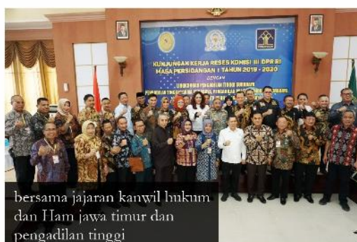
bersama jajaran kanwil hukum dan Ham Jawa timur dan pengadilan tinggi

"Iya tadi ada wacana dan usulan oleh bapak-ibu komisi III DPR RI terkait efisiensi kartu SIM dijadikan satu dengan E KTP, rencananya akan diusulkan ke pimpinan. Yang pasti kami siap jika memang itu sebagai bentuk pelayanan terbaik bagi masyarakat," tandasnya. (*)