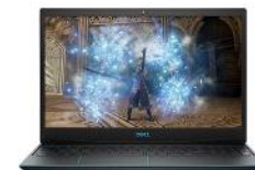
Dell G3 15

Dell G7 15 memiliki ukuran yang tipis. Dilengkapi dengan GPU Nvidia GeForce GTX 1060 Max-Q dengan 6GB VRAM, G7 lebih dari mampu memainkan game pada pengaturan tinggi. Untuk menjaga suhu laptop agar tidak cepat panas, G7 dilengkapi dengan