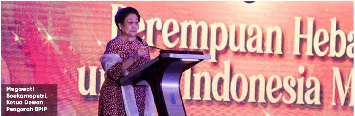
Megawati Soekarnoputri, Ketua Dewan Pengarah BPIP

J akarta- Ketua Dewan Pengarah Badan Pembinaan Ideologi Pancasila (BPIP) Megawati Soekarnoputri berbicara mengenai peran perempuan dari masa perjuangan hingga saat ini. Megawati menyebut tidak ada salahnya Panglima TNI suatu saat dijabat perempuan.