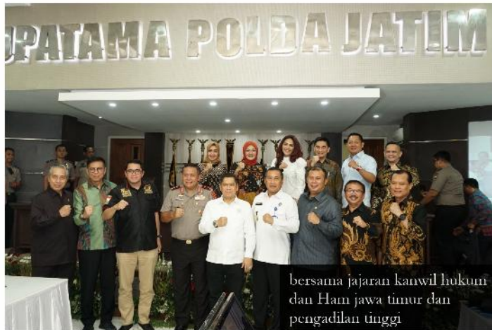
bersama jajaran kanwil hukum dan Ham Jawa timur dan pengadilan tinggi

Surabaya- Komisi III DPR RI membidangi : Hukum, HAM dan keamanan melakukan kunjungan selama 3 hari di Jawa Timur (Jatim), khususnya Surabaya, untuk memetakan berbagai permasalahan hukum, HAM dan Keamanan. Tak sekadar menampung problematika di lapangan, dalam reses ini para wakil rakyat aktif berdiskusi dengan pihak-pihak terkait untuk mencari solusi efektif.