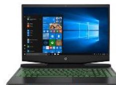
HP Gaming Pavilion 15 -dk0046nr