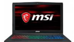
MSI GF63 8RB