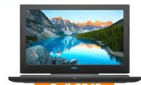
Dell G7 15