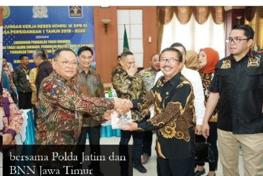
bersama Polda Jatim dan BNN Jawa Timur