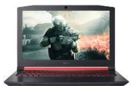
Acer Nitro 5