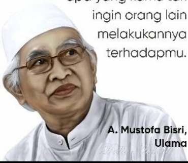
A. Mustofa Bisri, Ulama

Jangan lakukan terhadap orang lain apa yang kamu tak ingin orang lain melakukannya terhadapmu.