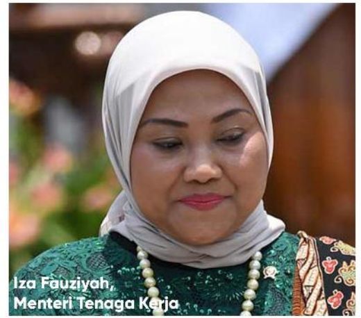
Iza Fauziah, Menteri Tenaga Kerja

Meski begitu, ide tersebut masih dalam pembahasan. Pemerintah masih membuka masukan baik dari kalangan pengusaha maupun buruh. "Itu (KHL) salah satu materi yang akan dibahas. Di omnibus law itu kan