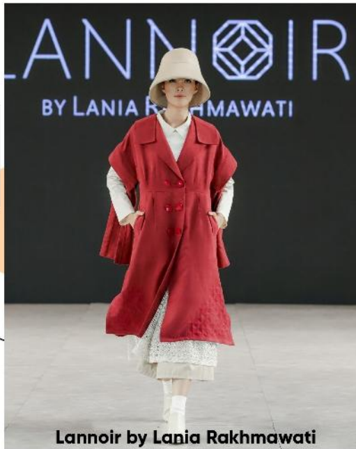
Lannoir by Lania Rakhmawati

Tahun 2020 sudah di depan mata. Semua orang bersiap menyongsong tahun tersebut, tak terkecuali para desainer Indonesia. Mereka telah menyiapkan produk unggulannya yang akan menjadi tren di tahun 2020. Sejumlah desainer pun menggambarkan tren fashion di 2020.