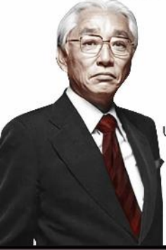
Akio Morita, Chairman Sony Corporation

"Jangan takut membuat kesalahan. Namun, pastikan anda tidak membuat kesalahan yang sama untuk kedua kalinya"