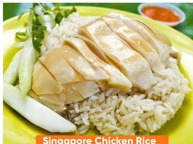
Singapore Chicken Rice