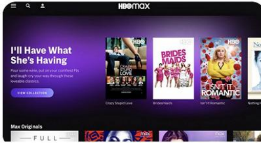
HBO Max adalah video berlangganan Amerika yang akan datang mengenai layanan streaming permintaan dari WarnerMedia Entertainment, sebuah divisi dari AT&T's WarnerMedia.

"Bisa dibilang, Anda tak bisa memiliki pengalaman bersama HBO Max tanpa Harry Potter menjadi bagian di dalamnya,"