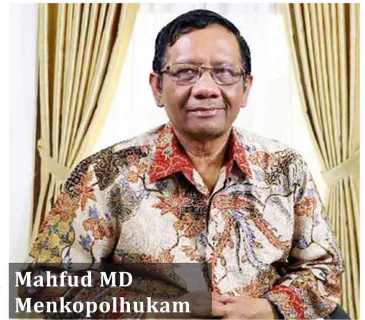
Mahfud MD Menkopolhukam

Karhutla sendiri mulai banyak terjadi kala musim kemarau, pada tahun 2019 karhutla dimulai Juli dan terus meningkat hingga Oktober dan baru menurun pada November. Provinsi Kalimantan Tengah menjadi luasan karhutla terbesar, total 161.298 hektare lahan terbakar dengan