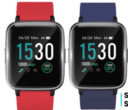
Smartwatch StartGo S1

StartGo S1 juga memiliki fitur “find my phone” hingga jangkauan 10 meter. Fitur ini membuat ponsel bisa dengan mudah ditemukan dengan mengontrol dering meng-