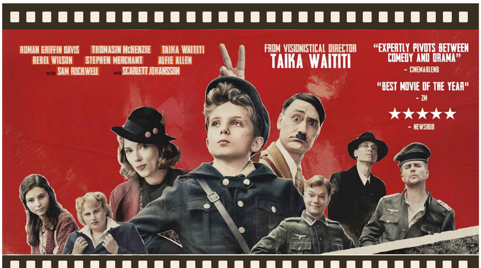
JOJO RABBIT (2019)

Meskipun bergenre komedi, namun film 'Jojo Rabbit' ini mengandung pesan yang cukup berat. Bahkan, film ini sempat membuat para petinggi Disney sebagai pemilik Fox merasa khawatir karena isinya yang cukup sensitive.