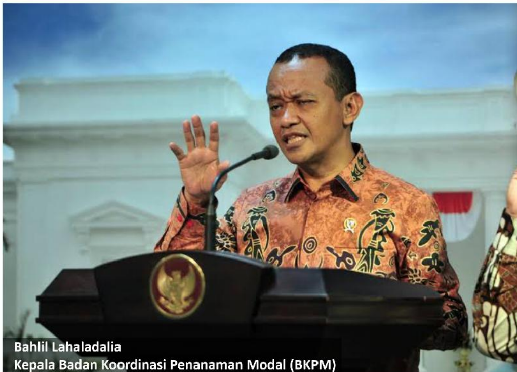
Bahlil Lahaladalia Kepala Badan Koordinasi Penanaman Modal (BKPM)

Jakarta - Presiden Joko Widodo (Jokowi) memercayakan urusan pengembangan investasi kepada pengusaha muda Bahlil Lahaladalia. Mantan Ketua Umum BPP Himpunan Pengusaha Muda Indonesia (HIPMI) itu kini menjadi Kepala Badan Koordinasi Penanaman Modal (BKPM).