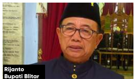
Rijanto Bupati Blitar

Mengenai deadline 7 hari sesuai rekomendasi pemkab, ditegaskan Bupati