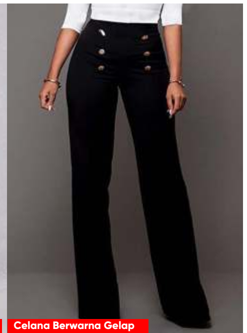
Celana Berwarna Gelap

M emiliki bentuk paha yang besar seringkali membuat perempuan merasa tidak percaya diri. Karena itulah, beberapa perempuan kerap melakukan berbagai cara untuk mendapatkan bentuk paha yang ideal. Salah satunya dengan rutin berolahraga hingga mengonsumsi makanan yang bergizi.