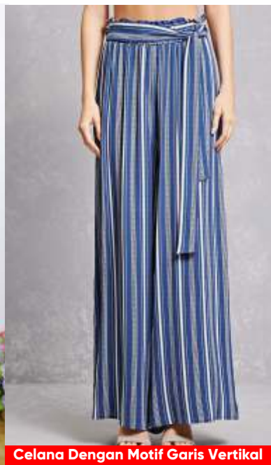
Celana Dengan Motif Garis Vertikal