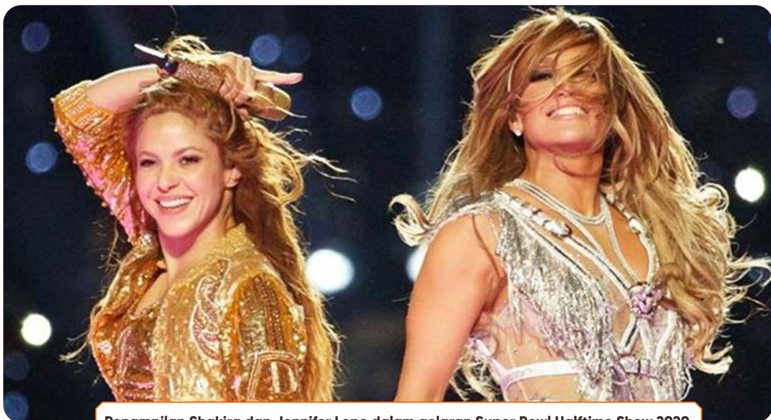
Penampilan Shakira dan Jennifer Lope dalam gelaran Super Bowl Halftime Show 2020.