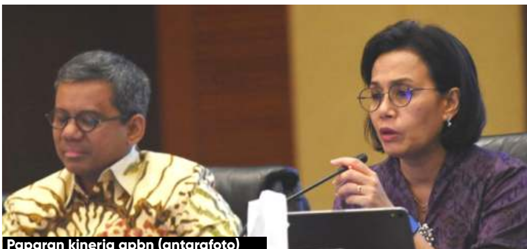
Paparan kinerja apbn

Dalam rapat itu, kenaikan iuran BPJS Kesehatan dibanjiri penolakan mulai dari alasan memberatkan rakyat miskin hingga ketidakjelasan data Penerima Bantuan Iuran