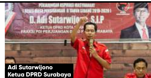
Adi Sutarwijono Ketua DPRD Surabaya

raturan Wali Kota Surabaya Nomor 58 Tahun 2019, data MBR tercatat 665.882 jiwa, terdiri atas sebanyak 202.572 KK (kartu keluarga)."Data akan terus diperbarui. Tidak stagnan. Dengan data ini, pemerintah kota bisa mempercepat pengentasan kemiskinan dengan intervensi kebijakan di bidang sosial, pendidikan, kesehatan, perbaikan rumah tidak layak, pemberdayaan ekonomi, kependudukan dan ketenagakerjaan," kata Adi.