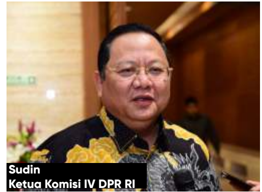
Sudin Ketua Komisi IV DPR RI

Pasalnya saat Komisi IV DPR RI meninjau dan Ditjen Gakkum mengamankan seorang komisaris dari korporasi yang mendirikan lahan perumahan di tanah hutan lindung, hingga saat ini Gakkum LHK telah menetapkan 3 pimpinan korporasi tersebut sebagai tersangka. Dia meminta agar menegakkan aturan perizinan.