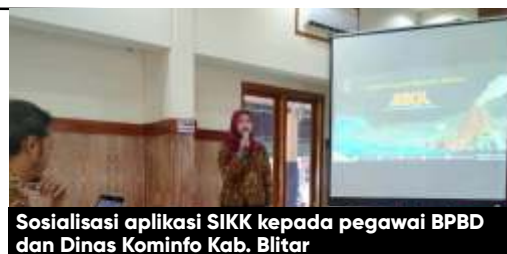
Sosialisasi aplikasi SIKK kepada pegawai BPBD dan Dinas Kominfo Kab. Blitar

Harapannya semua desa memiliki SID, untuk memudahkan akses informasi. Bahkan SID ini juga berpengaruh besar terhadap penanggulangan dan mengurangi risiko bencana. Eko menyampaikan jika SIKK ini dibuat untuk mempermudah akses informasi terkait data terbaru kebencanaan, penanggulangan dan