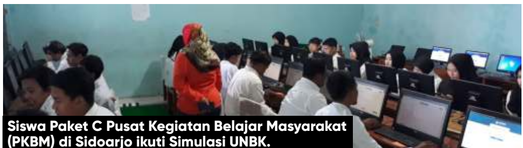
Siswa Paket C Pusat Kegiatan Belajar Masyarakat (PKBM) di Sidoarjo ikuti Simulasi UNBK.

Ia juga mengaku bahwa sebelum berangkat minta doa sang suami supaya bisa mengerjakan soal dan lancar "Sebelum berangkat aku minta doa sang