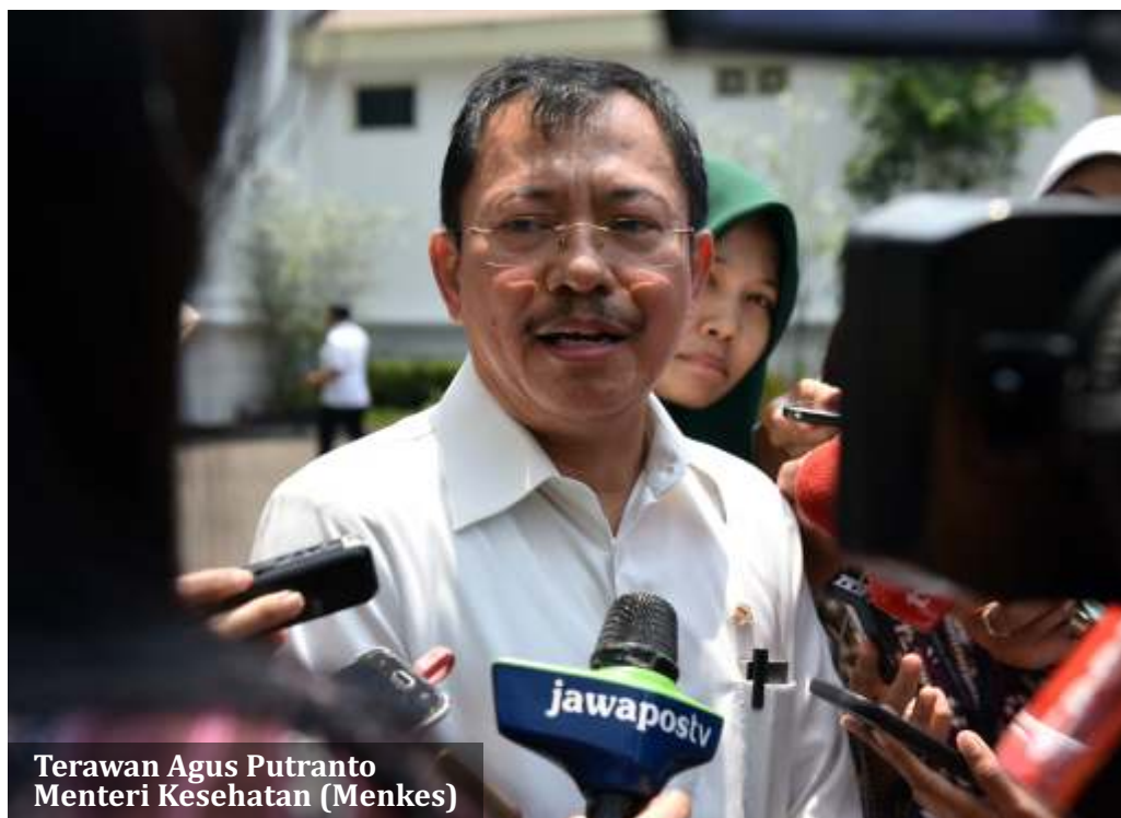
Terawan Agus Putranto Menteri Kesehatan (Menkes)

Jakarta - Menteri Kesehatan (Menkes) Terawan Agus Putranto menerangkan ada 9 WNI di Jepang yang terkena wabah virus corona COVID-19. Sembilan WNI tersebut tengah menjalani perawatan. "Saya terangkan nih, WNI yang kena kan juga dirawat oleh pemerintah Jepang yang sembilan orang itu," ujar Terawan di Kompleks Istana Kepresidenan, Jakarta Pusat, Senin (24/2).