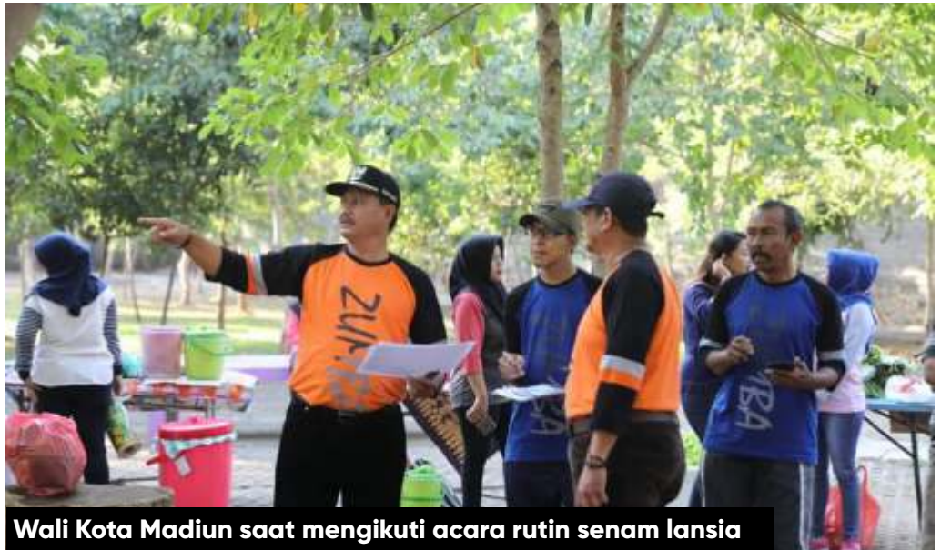
Wali Kota Madiun saat mengikuti acara rutin senam lansia

Tak hanya itu, pemerintah juga peduli terhadap kesehatan para lansia, dengan