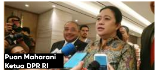
Puan Maharani Ketua DPR RI

Puan Maharani mengatakan, seluruh wakil rakyat memang memiliki kewajiban untuk menjaga kepercayaan publik terhadap kinerja lembaga legislatif. Pasalnya, sikap anggota DPR dipandang