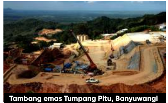
Tambang emas Tumpang Pitu, Banyuwangi

Sementara itu, Pemprov Jatim masih memenuhi tuntutan warga. Kepala Dinas Energi dan Sumberdaya Mineral (ESDM) Jatim, Setiajit mengatakan, pihaknya bisa memberi sanksi administrasi jika perusahaan tambang yang beroperasi di