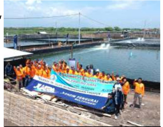
Kunjungan petambak Kab. Pemalang, Jateng ke kampung Juara, Desa Gerongan, Kec.Kraton, Kab. Pasuruan, Jatim

Enzim yang dibutuhkan udang ini merupakan jenis organik yang terdiri dari gabungan dari prebiotik, probiotik, enzim dan substrat. Secara spesifik akan mengoptimalkan kerja enzim, chellate, garam alkali dan vitamin yang dibutuhkan. Sampah organik dari perairan tambak yang berasal dari sisa pakan, feses, moulting akan dengan cepat dapat di degradasi agar tidak berbahaya bagi lingkungan perairan tambak.