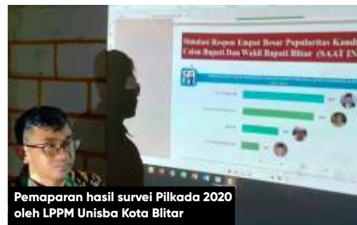
Pemaparan hasil survei Pilkada 2020 oleh LPPM Unisba Kota Blitar

Selanjutnya untuk simulasi respon 4 besar kandidat calon bupati dan wakil