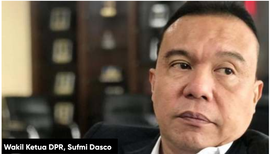
Wakil Ketua DPR, Sufmi Dasco

Dasco mengatakan, dari DPR tim kecil akan diwakilkan oleh Komisi IX DPR, dan Badan Legislasi. Nantinya tim tersebut akan membahas masukan berbagai kalangan mengenai RUU Cipta Kerja. Berbagai hambatan akan dibicarakan sehingga omnibus law dapat diselesaikan dengan baik.