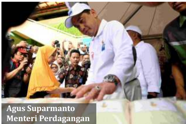
Agus Suparmanto Menteri Perdagangan