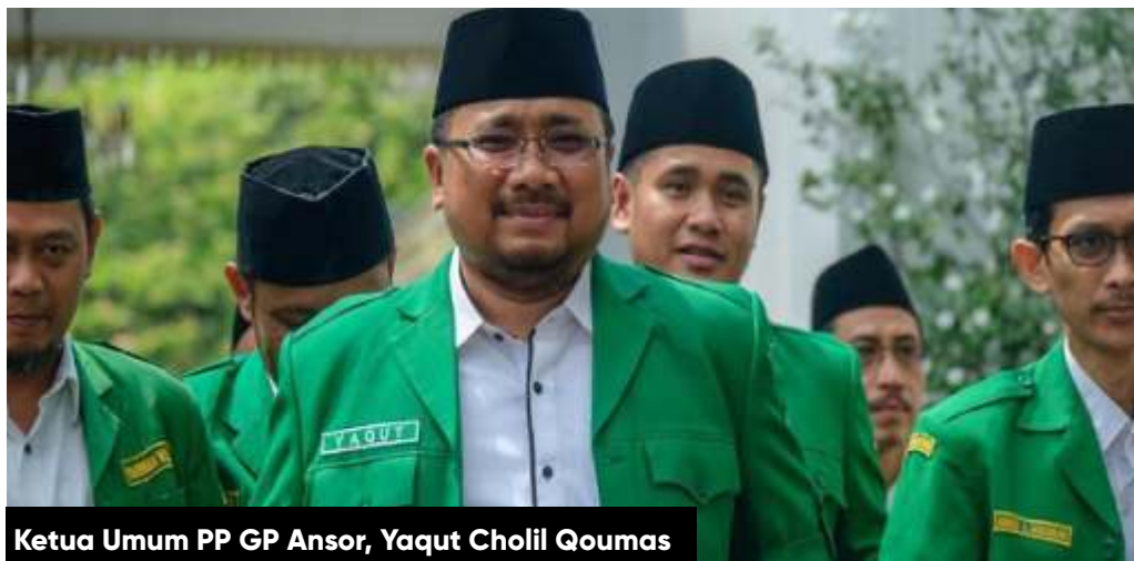
Ketua Umum PP GP Ansor, Yaqut Cholil Qoumas

Sanusi yang menjabat sebagai anggota Dewan Penasihat di PW GP Ansor Jatim juga akan maju dalam Pilbup Malang 2020. Bahkan kandidat petahana ini sudah mendapat rekomendasi dari PDI Perjuangan (PDIP).