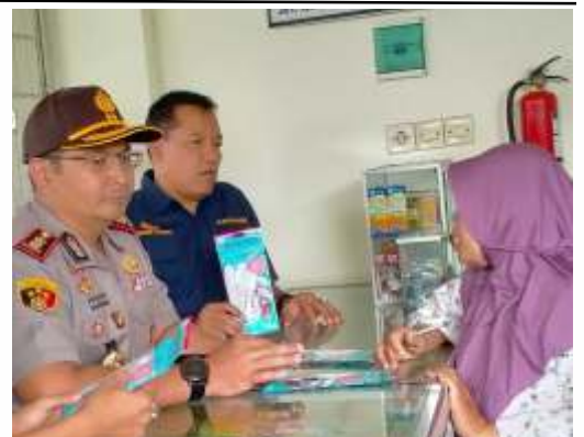
Kapolres Blitar, AKBP Ahmad Fanani bersama jajarannya melakukan sidak masker di beberapa apotek

Kelangkaan masker juga mulai dirasakan di Kota Madiun, harga satuan masker yang semula Rp 500 menjadi Rp 5.000/masker.