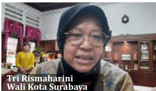
Tri Rismaharini Wali Kota Surabaya

S urabaya-Di tengah memanasnya isu corona di tanah air, Jumat (6/3) kapal pesiar Viking Sun Norwegia yang baru melakukan kunjungan di Australia akan bersandar di Pelabuhan Tanjung Perak, Surabaya. Wali Kota Surabaya, Tri Rismaharini menegaskan tidak punya kewenangan untuk menolak. Pihaknya memastikan akan melakukan antisipasi sebaik mungkin, termasuk menyiapkan alat thermal scanner untuk mengecek mengangkut 1.300 penumpang dan Anak Buah Kapal (ABK).