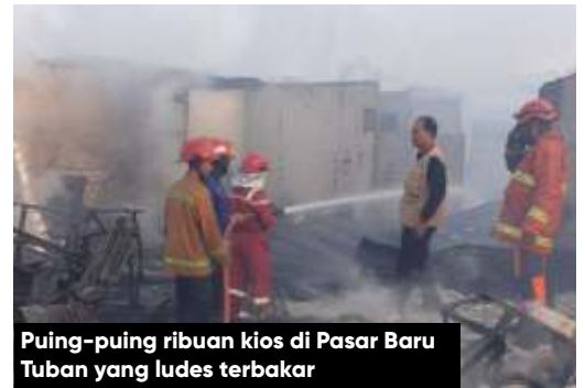
Puing-puing ribuan kios di Pasar Baru Tuban yang ludes terbakar

Kebakaran yang juga merembet sampai area wisata Gua Akbar ini diduga akibat