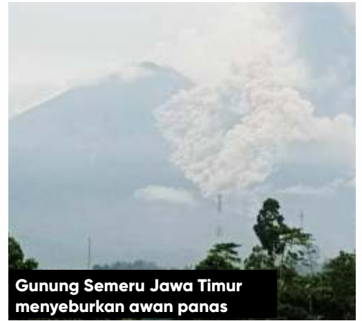
Gunung Semeru Jawa Timur menyemburkan awan panas

rakat yang berada di ring 1-3 untuk tetap tenang dan waspada. Serta masyarakat tidak melakukan aktivitas di wilayah sejauh empat kilometer di sektor lereng selatan-tenggara," lanjut Wawan.