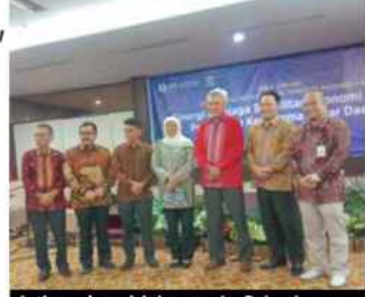
Jatim gelar misi dagang ke Pekanbaru, Riau untuk meningkatkan ekonomi lokal

Menurut Difi, potensi Jatim sangat terbuka untuk menjaga perekonomian tetap stabil pada saat ini. Hal itu dibuktikan bahwa latim merupakan pemasok bahan pokok dan komoditi lain ke 17 provinsi