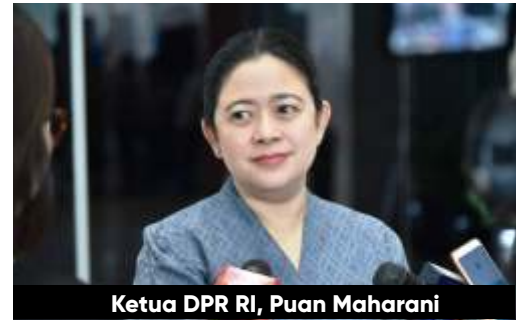
Ketua DPR RI, Puan Maharani

"Dari keempat alternatif itu, sejauh ini belum ada yang dilakukan secara baku. Kalaupun ada pembatasan sosial di daerah, itu justru lebih pada kebijakan kepala daerah.