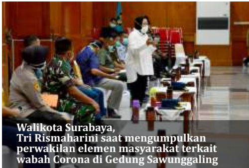
Walikota Surabaya, Tri Rismaharini saat mengumpulkan perwakilan elemen masyarakat terkait wabah Corona di Gedung Sawunggaling