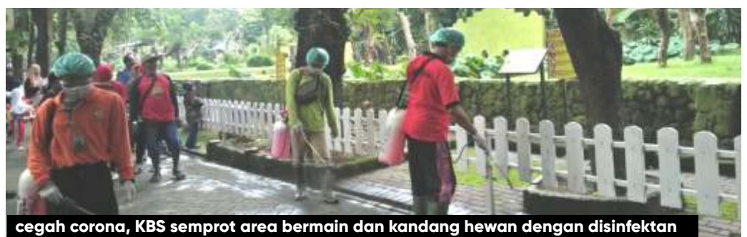
cegah corona, KBS semprot area bermain dan kandang hewan dengan disinfektan