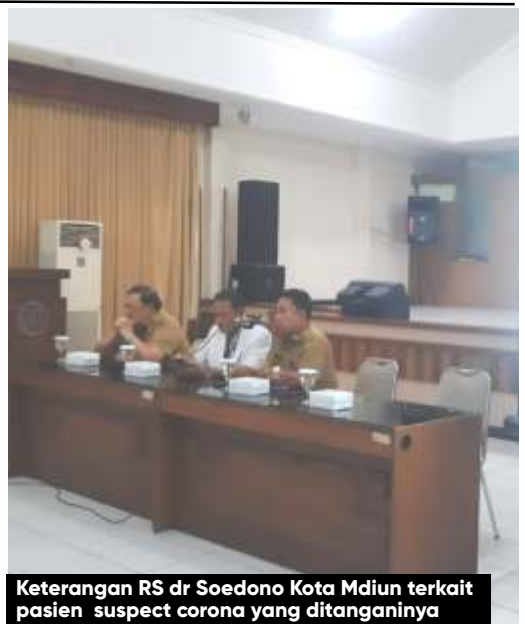
Keterangan RS dr Soedono Kota Mdiun terkait pasien suspect corona yang ditanganinya

Lebih lanjut orang nomor satu di Kota Madiun ini menjelaskan jika nantinya anak-