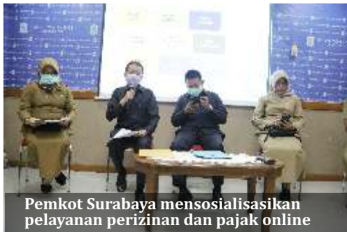
Pemkot Surabaya mensosialisasikan pelayanan perizinan dan pajak online

S urabaya- Upaya dalam pencegahan terkait corona yang terus digalakkan adalah dengan tidak keluar rumah, kecuali ada urusan sangat penting. Pemerintah Kota (Pemkot) Surabaya pun memfasilitasi warganya terkait pelayanan publik, mulai dari perizinan hingga bayar pajak secara online.