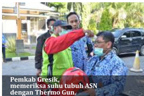
Pemkab Gresik, memeriksa suhu tubuh ASN dengan Thermo Gun.

Di samping melakukan penyemprotan disinfektan, Pemkot Surabaya juga membagi-bagikan hand sanitizer gratis kepada masyarakat. Hand sanitizer ini merupakan produksi mandiri dari Dinkes Surabaya yang sengaja ditujukan kepada masyarakat yang membutuhkan, seperti para penumpang di terminal bus-bus, Damri, hingga pekerja Ojek Online (Ojol). (ard)