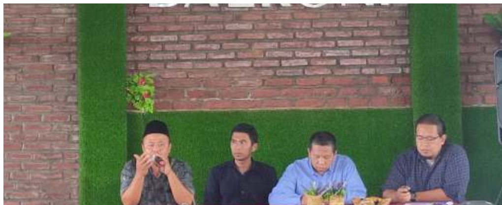
KPU Kabupaten Sidoarjo dan KPU Provinsi Jatim saat bertemu Insan Media di Balkoni Kafe, Sidoarjo.

Partisipasi politik, lanjutnya, menjadi salah satu tolak ukur berjalan atau tidaknya demokrasi. Untuk itu, diperlukan wadah yang menjadi sarana peningkatan parti-