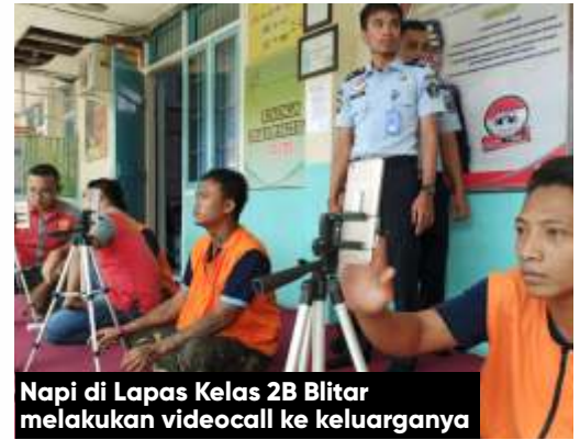
Napi di Lapas Kelas 2B Blitar melakukan videocall ke keluarganya

Dijelaskannya sebagai pengganti dihentikannya Layanan Kunjungan ini, Lapas menyediakan Layanan Video Call. "Secara bergantian, warga binaan yang sudah mengisi daftar akan dipanggil untuk melakukan Video Call dengan keluarganya," jelasnya.