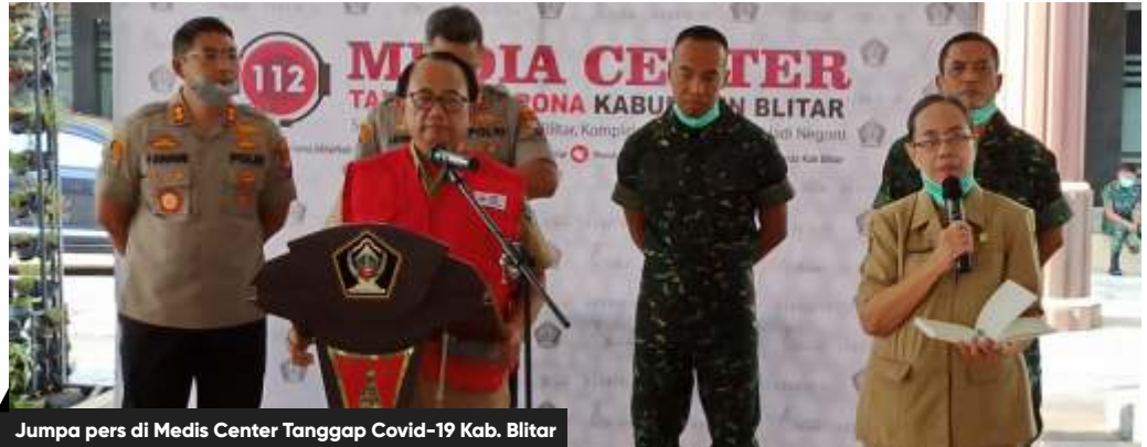
Jumpa pers di Media Center Tanggap Covid-19 Kab. Blitar

Berbagai kebijakan juga sudah dikeluarkan, untuk mencegah keramaian. "Menutup tempat wisata, hiburan, gedung pertunju-