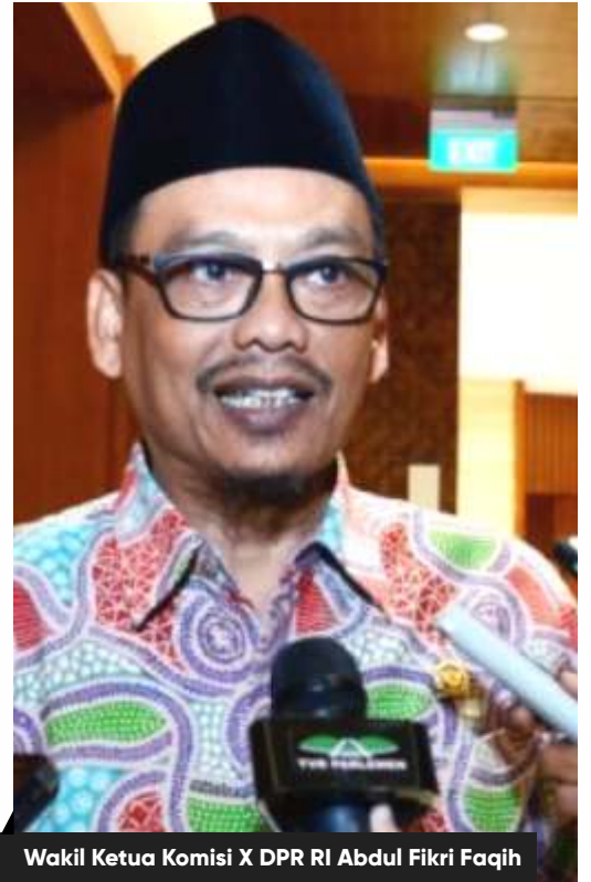
Wakil Ketua Komisi X DPR RI Abdul Fikri Faqih

Beberapa waktu lalu, Mendikbud Nadiem Makarim siap mendukung implementasi penundaan Ujian Nasional (UN) jika diperlukan. Menurutnya, hal ini demi memastikan keamanan dan keselamatan semua warga sekolah dari paparan virus corona.