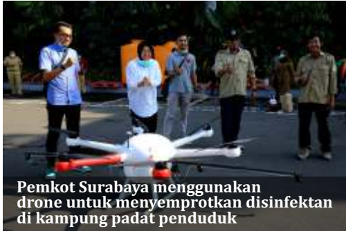
Pemkot Surabaya menggunakan drone untuk menyemprotkan disinfektan di kampung padat penduduk

Surabaya - Wali Kota Surabaya Tri Rismaharini terus melakukan upaya pencegahan meluasnya wabah corona. Terbaru, Pemkot Surabaya menggunakan drone untuk menyemprotkan disinfektan di jalan dan di kampung-kampung padat penduduk.