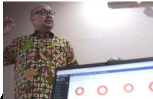
Komisioner Komisi Pemilihan Umum (KPU) Ilham Saputra

Titi mencontohkan, misalnya dalam hal penundaan tahapan verifikasi faktual syarat dukungan bakal calon perseorangan, akan berdampak pada tahapan pendaftaran calon. Jika tahapan ini pelaksanaannya