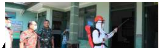
Penyemprotan Fasilitas Umum PAUD-TK Bersama TNI

Termasuk menyiapkan logistik mulai dari 28.000 lembar masker bedah dan 598 masker N95, serta sarana prasarana 7 rumah sakit tipe B, C dan D dengan 647 tempat tidur, 38 ruang isolasi dan 714 tenaga medis (dokter dan perawat). (adv/ais)