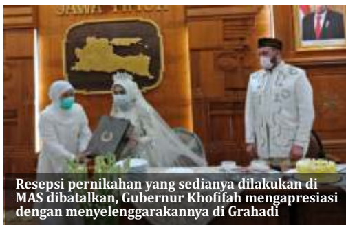
Resepsi pernikahan yang sedianya dilakukan di MAS dibatalkan, Gubernur Khofifah mengapresiasi dengan menyelenggarakannya di Grahadi

S URABAYA - Merebaknya wabah virus Corona (Covid-19) di Jawa Timur membuat jalur distribusi barang dan jasa menjadi terhambat. Termasuk ekspor dan impor yang keluar masuk provinsi ini. Wakil Gubernur Jawa Timur, Emil Elestianto Dardak mengakui ada beberapa industri yang mulai terdampak kondisi ini..