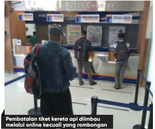
Pembatalan tiket kereta api diimbau melalui online kecuali yang rombongan

Ditanya mengenai jumlah calon penumpang yang membatalkan tiket di stasiun wilayah Daop 7, Ixfan mengaku datanya