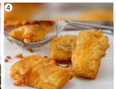
4 Mengganti Alas Tisu