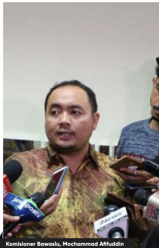
Komisioner Bawaslu, Mochammad Afifuddin

Yang jelas menurut Mahfud, pemerintah tak mau mencampuri apapun keputusan KPU. Sebab secara struktural KPU adalah Lembaga Independen. Menurutnya, apapun keputusan KPU tak mesti diskusi terlebih dahulu dengan pemerintah.