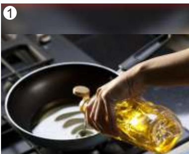
1 Minyak Belum Atau Kurang Panas

Soalnya, tisu yang berminyak berarti telah kehilangan kemampuannya untuk menyerap minyak yang masih ada di pisang goreng (Ist).