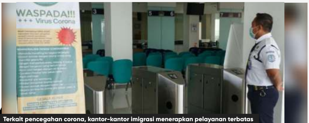
Terkait pencegahan corona, kantor-kantor imigrasi menerapkan pelayanan terbatas

Tidak hanya pembatasan permohonan paspor, pelayanan ijin orang asing juga