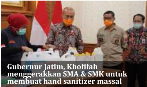
Gubernur Jatim, Khofifah menggerakkan SMA & SMK untuk membuat hand sanitizer massal

Surabaya - Provinsi Jawa Timur akan memaksimalkan peran SMA double track dan SMK untuk memproduksi hand sanitizer (cairan pencuci tangan) secara massal. Hand sanitizer tersebut nantinya akan dibagikan kepada masyarakat luas.