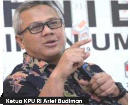
Ketua KPU RI Arief Budiman

ngutan suara dapat dilakukan melalui Peraturan Pemerintah Pengganti Undang-Undang (Perppu) Pilkada. Akan tetapi, berbagai pihak harus mengkaji sejumlah dampak penundaan pilkada tersebut.