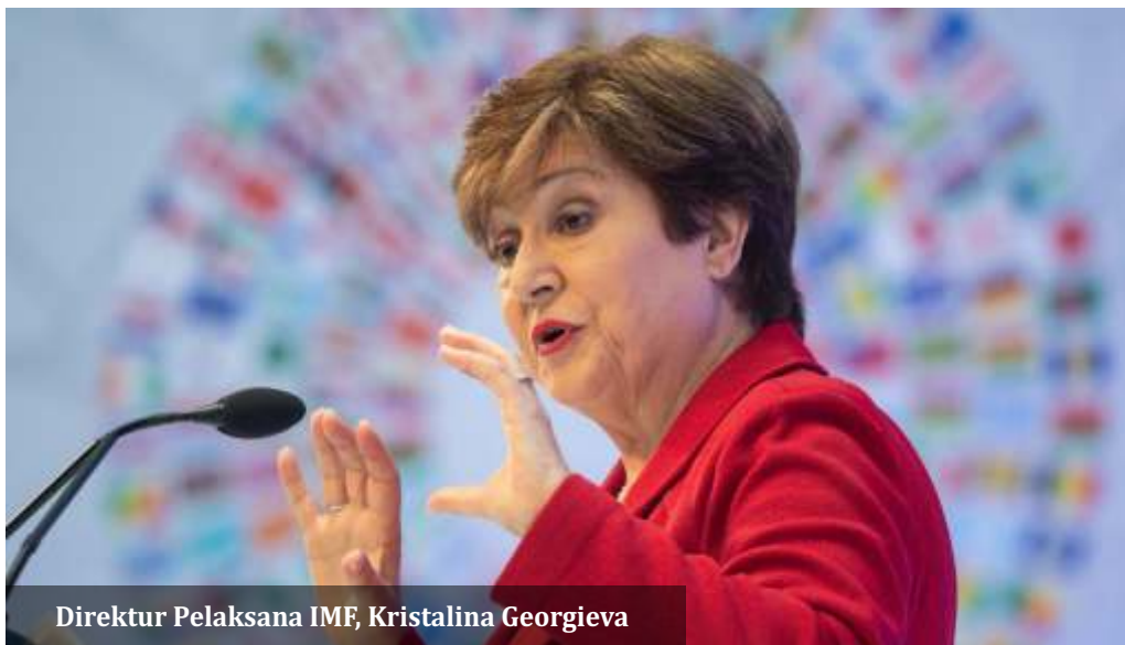
Direktur Pelaksana IMF, Kristalina Georgieva

Jakarta-Dana Moneter Internasional (International Monetary Fund/IMF) menyatakan pandemi virus corona telah membuat krisis ekonomi dan keuangan global. Bahkan kondisinya lebih buruk dibandingkan krisis 2008. Indonesia pun diprediksi bisa tumbuh 0% alias stagnan dalam prediksi terburuknya.