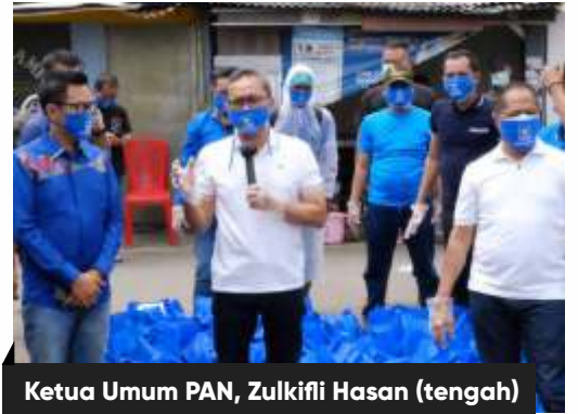
Ketua Umum PAN, Zulkifli Hasan (tengah)

PAN juga meminta pemerintah memaksimalkan distribusi alat pelindung diri (APD) ke daerah-daerah terpapat virus Corona. Zulhas menyebut APD merupakan salah satu alat penting untuk mencegah penularan.