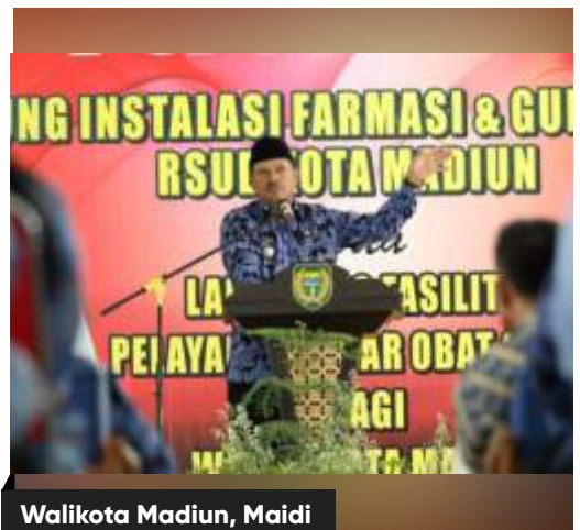
Walikota Madiun, Maidi

Lebih lanjut walikota menambahkan jika beberapa tempat di RS Sogaten tidak cukup, antisipasi Pemkot selanjutnya yakni menyiapkan beberapa ruangan di Asrama Haji. Terkait penunjukkan tersebut wali-