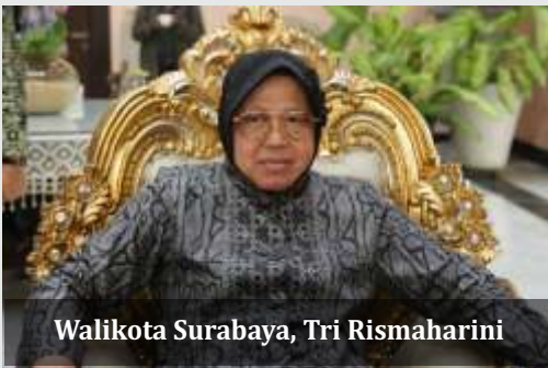
Walikota Surabaya, Tri Rismaharini

Menurut Khofifah, drive thru disinfektan akan dipasang di sejumlah titik seperti di Suramadu dan pelabuhan. Sehingga penyebaran Covid-19 bisa dicegah. "Kita akan maksimalkan di titik-titik pelabuhan yang dari Probolinggo, Situbondo dan dari kepulauan di Sumenep, kita akan berkoordinasi supaya penyiapan tenda drive thru disinfektan di titik itu bisa segera dilakukan. Pada dasarnya disinfektan yang ada di pemprov cukup untuk melakukan tugas-tugas itu," ucap Khofifah.(ins)