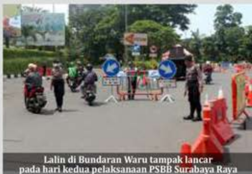
Lalin di Bundaran Waru tampak lancar pada hari kedua pelaksanaan PSBB Surabaya Raya

Di hari pertama pelaksanaan PSBB, para petugas gabungan melakukan pengecekan mobilitas masyarakat di 19 check point di Kota Surabaya, 13 check point di Kabupaten Gresik dan 20 check point di Kabupaten Sidoarjo. (ufi,ist)