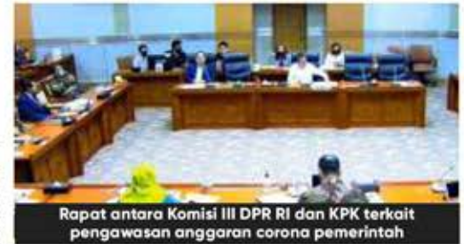
Rapat antara Komisi III DPR RI dan KPK terkait pengawasan anggaran corona pemerintah

"Kalau ini segini besar saya kira KPK harus konsen mengawasi ini, ini betul betul menjadi rawan. KSP mengumumkan delapan itu tidak pakai tender, kan tidak