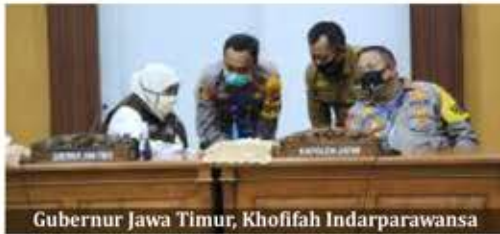
Gubernur Jawa Timur, Khofifah Indarparawansa

Surabaya - Setelah mengevaluasi jalannya Pembatasan Sosial Berskala Besar (PSBB) Surabaya Raya, Gubernur Khofifah Indarparawansa mengundang Asosiasi Pengusaha Indonesia (Apindo). Khofifah meminta para pengusaha mengatur ulang shift karyawannya. Pasalnya, pemicu kemacetan di Bundaran Waru saat hari pertama pelaksanaan PSBB diindikasikan masih banyaknya warga yang harus ke tempat kerja.