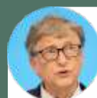
Pendiri Microsoft Bill Gates

"Jika suatu negara melakukan pekerjaannya dengan baik, dengan pengujian dan 'shutdown' (social distancing) dalam 6-10 minggu mereka akan melihat jumlah kasus yang berkurang banyak dan bisa kembali membuka negaranya."