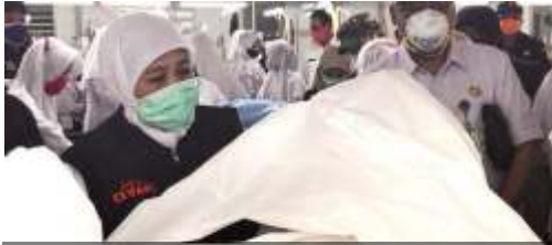
Gubernur Jatim Khofifah mendampingi pabrik APD di Kota Probolinggo

Surabaya- Seperti diprediksi sebelumnya, social distancing hingga work from home yang menjadi langkah menangkal corona ternyata memicu mudik lebih awal. Di Jatim misalnya, selama dua pekan terdapat pergerakan sebanyak 25.450 orang masuk ke provinsi ini. Gubernur Jawa Timur Khofifah Indar Parawansa meminta semua pihak saling membantu dengan cara melapor ke perangkat desa masing-masing.