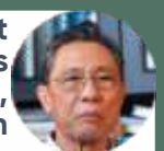
Penasihat kesehatan medis pemerintah China, Zhong Nanshan

"Jika suatu negara melakukan pekerjaannya dengan baik, dengan pengujian dan 'shutdown' (social distancing) dalam 6-10 minggu mereka akan melihat jumlah kasus yang berkurang banyak dan bisa kembali membuka negaranya."