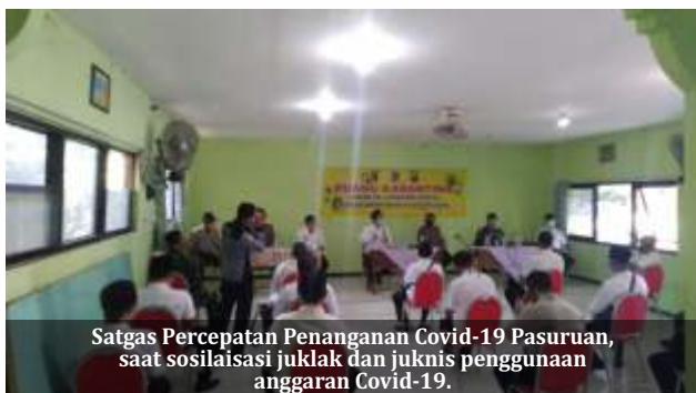
Satgas Percepatan Penanganan Covid-19 Pasuruan, saat sosialisasi juklak dan juknis penggunaan anggaran Covid-19.

P asuruan- Pemerintah Kabupaten (Pemkab) Pasuruan menggelontorkan anggaran sebesar Rp 100 juta ke kecamatan-kecamatan untuk percepatan penanganan wabah corona.