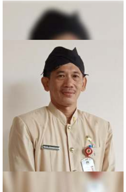
Plt Kepala Dinas Pendidikan Kota Blitar, Priyo Suhartono

Disinggung mengenai batasan alokasi anggaran Dana BOS untuk pembelian kuota data internet di tiap sekolah, Priyo mengaku ditentukan oleh masing-masing sekolah secara proporsional sesuai jumlah murid yang layak dibantu dan kebutuhan kuota