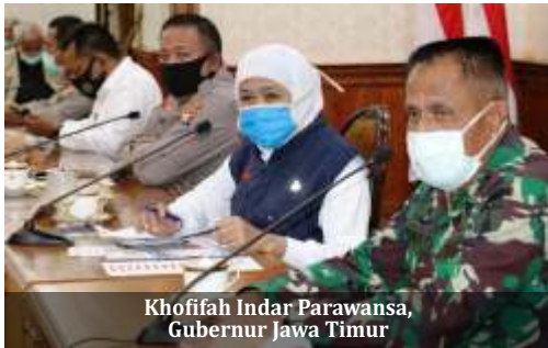
Khofifah Indar Parawansa, Gubernur Jawa Timur

S urabaya- Pada tahap 1 kartu prakerja, Provinsi Jawa Timur mendapatkan kuota sebanyak 15.000 orang. Angka ini memang jauh lebih kecil dari kumulatif pendaftar yang menembus angka 62.000 orang.