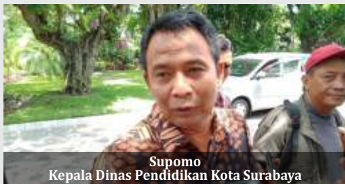
Supomo Kepala Dinas Pendidikan Kota Surabaya

Sebagaimana diketahui pekerja yang terdampak Covid-19 di Jatim mencapai puluhan ribu. Per tanggal 16 April 2020, jumlah orang terdampak di sektor Ketenagakerjaan di Jatim mencapai 38.919 orang. Dimana yang mengalami PHK 4.229 orang, kemudian yang dirumahkan ada sebanyak 28.558 orang. Sedangkan dari PMI yang terdampak ada sebanyak 6.132 orang. (ufi,ist)