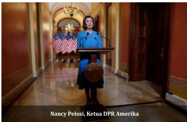
Nancy Pelosi, Ketua DPR Amerika

J akarta - Ketua DPR Amerika, Nancy Pelosi, memastikan parlemen akan mempermasalahkan keputusan Presiden Donald Trump menahan dana bantuan Organisasi Kesehatan Dunia (WHO). Menurutnya, Trump telah melakukan langkah yang berbahaya, terutama di tengah pandemi virus Corona (COVID-19).