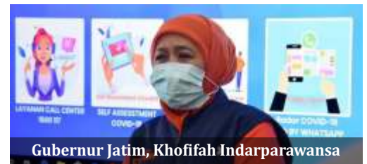
Gubernur Jatim, Khofifah Indarparawansa

Menurut Khofifah, pola penyaluran secara non tunai dilakukan agar jumlah uang yang