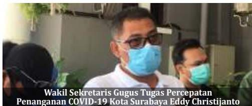
Wakil Sekretaris Gugus Tugas Percepatan Penanganan COVID-19 Kota Surabaya Eddy Christijanto

Surabaya- Pada hari ke-8 penerapan pembatasan sosial berskala besar (PSBB) untuk mengendalikan penularan virus Covid-19, ditemukan 290 dari 2.504 masjid dan musala di Kota Surabaya yang masih melakukan tarawih berjamaah. Kondisi ini memprihatinkan karena Kota Pahlawan merupakan zona merah di Jawa Timur.