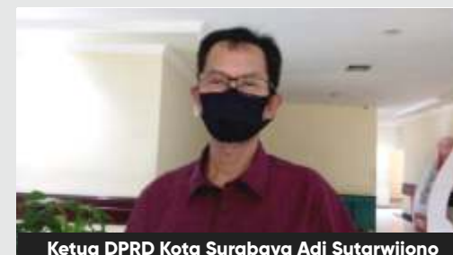
Ketua DPRD Kota Surabaya Adi Sutarwijono

Selain dengan rapat-rapat, lanjut dia, fungsi pengawasan di masa pandemi ini juga bisa dijalankan DPRD dengan melakukan inspeksi atau peninjauan lapangan. "Tentu saja, harus dengan protokol kesehatan yang baik di masa pandemi Covid-