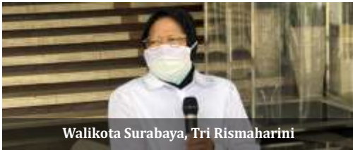
Wali Kota Surabaya, Tri Rismaharini

Surabaya- Pemerintah Kota Surabaya membentuk 'Kampung Wani Jogo Suroboyo' sebagai upaya memutus rantai penyebaran corona. Diketahui Surabaya merupakan episentrum penyebaran corona di Jawa Timur. Wali Kota Surabaya, Tri Rismaharini, mengatakan program tersebut dibentuk untuk membangun kedisiplinan warga agar menaati protokol pencegahan Covid-19.