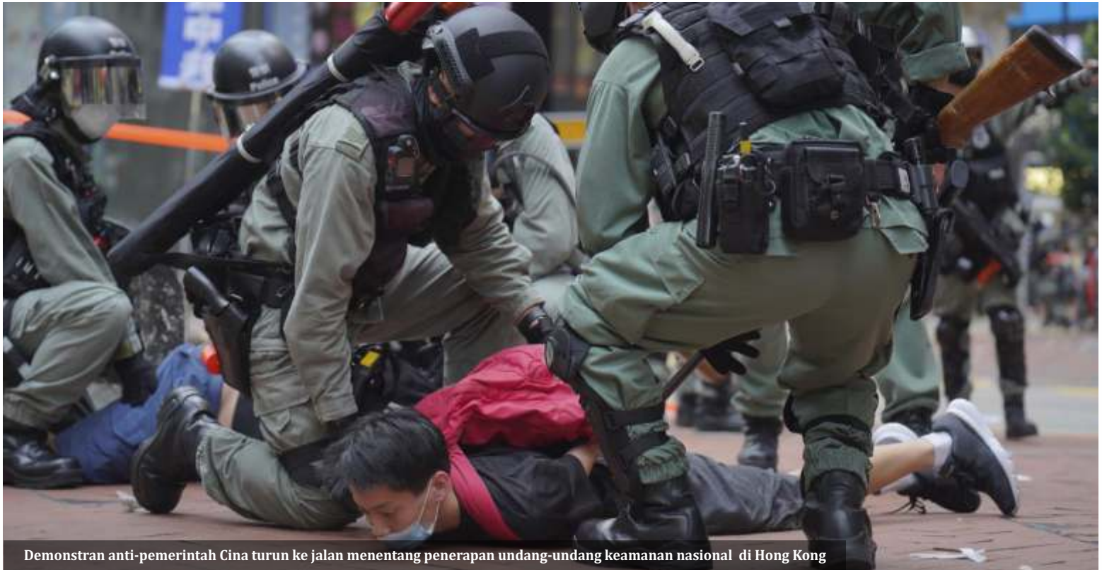
Demonstrasi anti-pemerintah Cina turun ke jalan menentang penerapan undang-undang keamanan nasional di Hong Kong

Jakarta - Hong Kong selama ini terkenal sebagai pusat keuangan Asia. Bahkan, selama aksi protes massa berbulan-bulan lamanya, status itu masih mampu dipertahankan. Namun, sejak Cina mengumumkan bakal menerapkan Undang-Undang Keamanan Nasional, Hong Kong terancam kehilangan status tersebut.