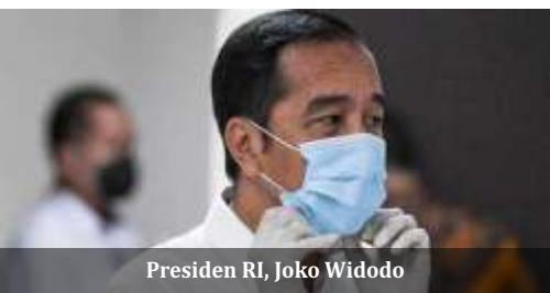
Presiden RI, Joko Widodo

Jakarta-Lembaga Indobarometer merilis survei mengenai kinerja pemerintah dalam penanganan wabah virus corona. Survei tersebut mencatat, sebanyak 53,8 persen warga tidak puas dengan cara pemerintahan Jokowi-Ma'ruf Amin dalam menangani wabah corona.