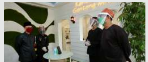
Bupati Banyuwangi Abdullah Azwar Anas mengecek new normal pelayanan publik di desa dan kecamatan

rogo disesuaikan dengan imbauan yang selama ini sudah diterangkan melalui media. Saat bekerja seperti biasa, masyarakat harus rajin cuci tangan. "Sekarang banyak tempat dipastikan harus ada fasilitas cuci tangan, di Ponorogo sudah lumayan tercukupi," terang Ipong.