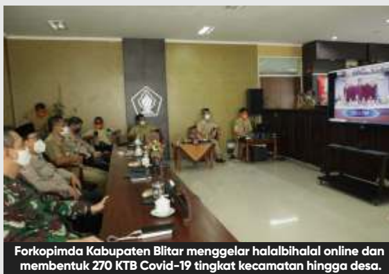
Forkopimda Kabupaten Blitar menggelar halalbihalal online dan membentuk 270 KTB Covid-19 tingkat kecamatan hingga desa.

Sesuai dengan pesan dari Gubernur Jatim, Kapolda dan Pangdam, salah satu upaya menghadapi Covid-19, yaitu dengan pem-