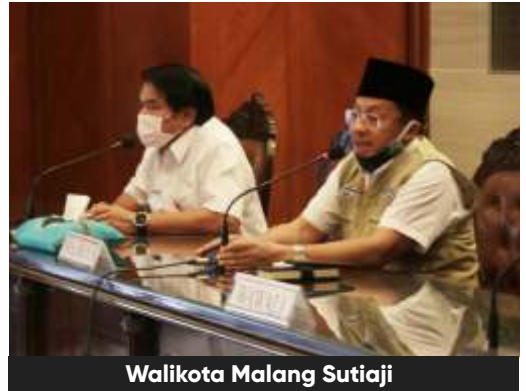
Walikota Malang Sutiaji

Namun, meski PSBB Malang Raya tidak diperpanjang dan aktivitas pereko-