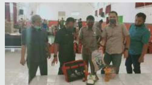
Komisi III DPRD Kota Blitar melakukan pengawasan penyaluran bingkisan lebaran untuk guru ngaji dan gakin.