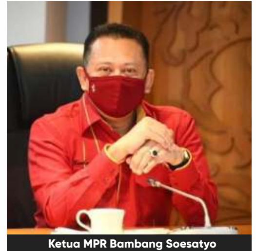
Ketua MPR Bambang Soesatyo

Dia mencontohkan Kota Beijing, China harus kembali di-lockdown karena adanya klaster baru Covid-19 di kota itu. Belajar dari pengalaman buruk Beijing, semua elemen masyarakat harus menyukseskan era pola hidup baru.