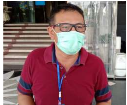
Wakil Sekretaris Gugus Tugas Percepatan Penanganan Covid-19 Surabaya Irvan Widyanto

Penempatan tempat cuci tangan (wastafel) dengan sabun dan pembersih tangan mengandung alkohol di pintu masuk dan pintu keluar dalam jumlah cukup menjadi syarat selanjutnya. Juga harus dilakukan pembersihan menggunakan desinfektan pada tempat hajatan sebelum dan sesudah