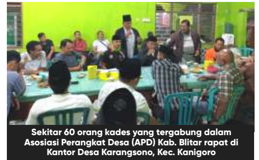
Sekitar 60 orang kades yang tergabung dalam Asosiasi Perangkat Desa (APD) Kab. Blitar rapat di Kantor Desa Karangsono, Kec. Kanigoro

Kondisi di lapangan seperti inilah yang dihadapi para kades, sehingga sebagai ujung