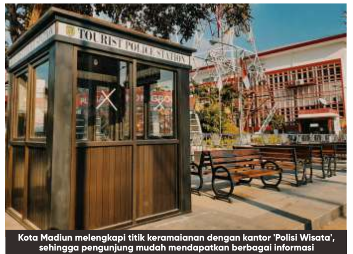
Kota Madiun melengkapi titik keramaian dengan kantor 'Polisi Wisata', sehingga pengunjung mudah mendapatkan berbagai informasi

"Di klaster depannya balai kota disekitar sumber umis itu ada videotron seperti di Jepang. Jadi kalau orang berdiri di depan videotronnya ada gambar orangnya di situ dan bagus untuk dibuat foto," beber mantan