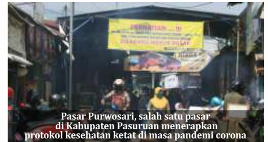
Pasar Purwosari, salah satu pasar di Kabupaten Pasuruan menerapkan protokol kesehatan ketat di masa pandemi corona

"Sejauh ini belum ada kebijakan dari pusat dan juga di Jatim untuk pemberlakuan new normal. Sehingga, WFH bagi ASN