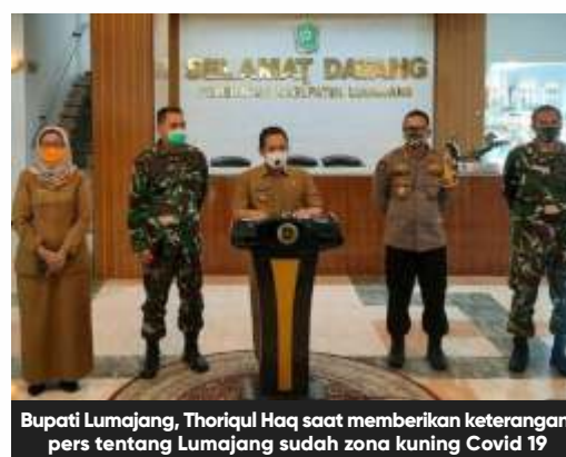
Bupati Lumajang, Thoriqul Haq saat memberikan keterangan pers tentang Lumajang sudah zona kuning Covid 19

"TNI dan Polri bersama pemerintah daerah akan turun antara 1-2 pekan dalam operasi nyata dalam penggunaan masker, agar masyarakat semakin patuh dan