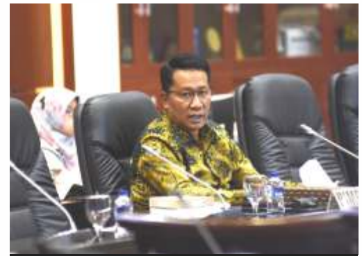
Ketua Badan Legislasi (Baleg) DPR RI, Supratman Andi Agtas

Pertanyaan kedua terkait peran dan fungsi pelaku usaha, khususnya swasta dalam upaya penciptaan lapangan kerja. Apakah pelibatan pelaku usaha swasta dalam penciptaan lapangan kerja me-