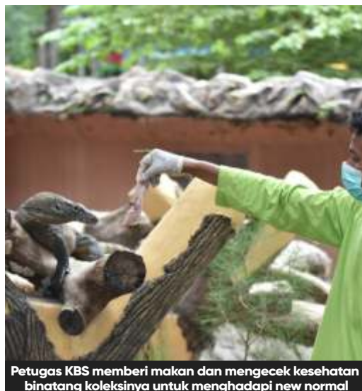
Petugas KBS memberi makan dan mengecek kesehatan binatang koleksinya untuk menghadapi new normal

Sementara itu Kantor Dinas Kebudayaan dan Pariwisata (Disbudpar) Surabaya ditutup untuk sementara, pasalnya ada dua temuan kasus Covid-19 di lingkungan