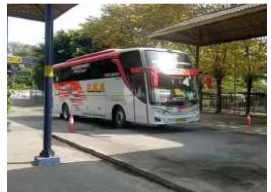
Terminal Purboyo Madiun mulai beroperasi kembali pasca ditutup selama 3 bulan akibat Covid-19

Suyatno mengatakan jika dibukanya Terminal Purboyo Madiun tak lepas dari keputusan Gubernur Jawa Timur (Jatim) Khofifah Indar Parawansa yang tidak memperpanjang masa PSBB di Surabaya Raya. Suyatno berharap dengan adanya