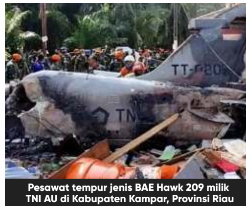
Pesawat tempur jenis BAE Hawk 209 milik TNI AU di Kabupaten Kampar, Provinsi Riau