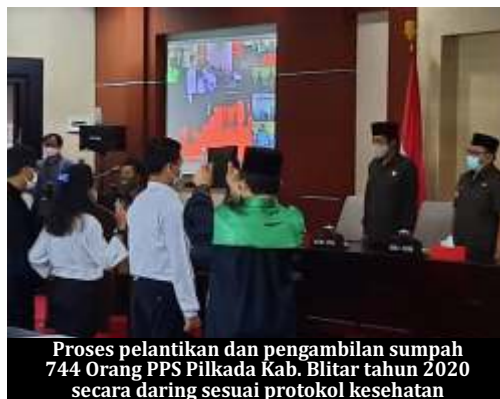
Proses pelantikan dan pengambilan sumpah 744 Orang PPS Pilkada Kab. Blitar tahun 2020 secara daring sesuai protokol kesehatan

Dijelaskan Bupati Rijanto, Pilkada serentak 2020 pada saat pandemi jadi tantangan tersendiri, karena harus berkualitas dan berintegritas. "Serta yang paling penting penyelenggaraan Pilkada harus profesional, menjaga netralitas, independensi dan mematuhi protokol