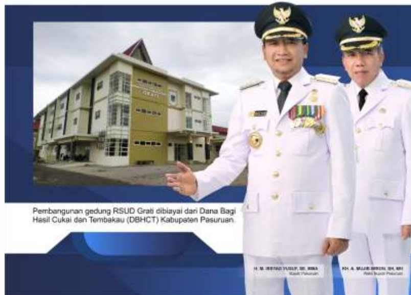
Pembangunan gedung RSUD Grati dibiayai dari Dana Bagi Hasil Cukai dan Tembakau (DBHCT) Kabupaten Pasuruan.

DENGAN MEMBELI ROKOK BERCUKAI ASLI BERARTI KITA TELAH IKUT MEMBERIKAN KONTRIBUSI BAGI PEMBANGUNAN DAERAH