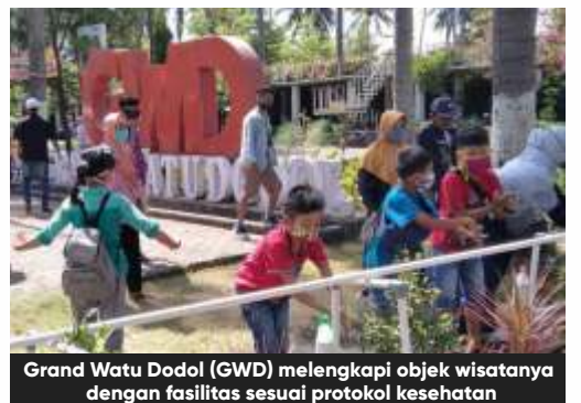
Grand Watu Dodol (GWD) melengkapi objek wisatanya dengan fasilitas sesuai protokol kesehatan

tidak terdampak atau berada di zona hijau bisa langsung melaksanakan new normal. Akan tetapi, jika daerah tersebut berada di kawasan beresiko rendah atau zona kuning maka bisa menyiapkan transisi menuju new normal.