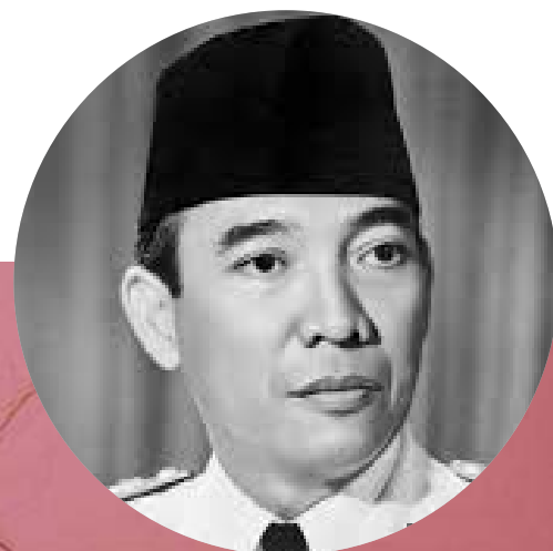
Dr. Ir. H. Soekarno Presiden pertama Republik Indonesia

"Aku coba untuk membawakan berbagai genre musik pop lewat lagu-lagu yang aku cover. Tujuannya adalah untuk berlatih sekaligus juga ingin mencari warna serta karakter musik dan lagu yang benar-benar cocok untuk aku," ujarnya (Ist).