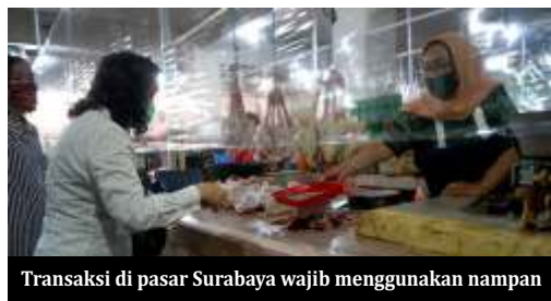
Transaksi di pasar Surabaya wajib menggunakan nampan

Dia juga mengatakan, pembelajaran tatap muka juga harus mendapat rekomendasi dari pemda, Gugus Tugas Covid-19 di daerah dan Kanwil Kemenag. Agus juga memastikan jajaran 4 menteri ini terus melakukan koordinasi, termasuk juga dengan DPR. (ist)