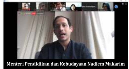
Menteri Pendidikan dan Kebudayaan Nadiem Makarim

"SKB ini merupakan panduan penyelenggaraan pembelajaran tahun ajaran baru di masa pandemi Covid-19 bagi satuan pendidikan formal, dari jenjang pendidikan tinggi sampai pendidikan usia dini dan pendidikan non-formal. Ada beberapa ketentuan teknis terkait pendidikan tinggi pesantren yang akan diatur lebih lanjut oleh Mendikbud dan Menag," tambah dia.