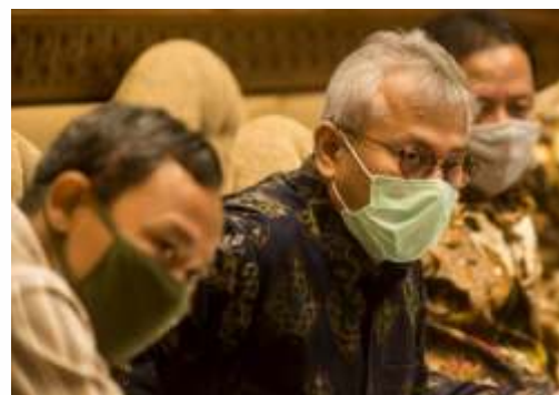
Ketua KPU Arief Budiman (tengah) dan Ketua Bawaslu Abhan (kanan) saat rapat dengan DPR Komisi III

Keua KPU, Arief menjelaskan, pihaknya sudah berkali-kali merevisi jadwal pilkada hanya karena anggarannya belum dicairkan oleh pemerintah. "Kami sebetulnya minta batas waktunya 15 Juni. Karena 15 Juni tahapan dimulai. Tapi karena kami meyakini bahwa proses butuh waktu panjang, tahapan verifikasi faktual yang semula kita jadwalkan 18 Juni, kita geser lagi jadi 24 Juni. Ternyata sampai tanggal 24 Juni pun anggaran belum bisa dicairkan," kata Arief.