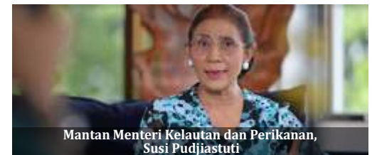
Mantan Menteri Kelautan dan Perikanan, Susi Pudjiastuti

Edhy juga menegaskan bahwa tidak ada pelanggaran dalam kegiatan ekspor benih lobster yang telah berjalan sejauh ini. Namun, ia mengakui bahwa aturan terkait tarif PNBP masih dalam tahap