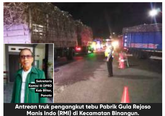
Antrean truk pengangkut tebu Pabrik Gula Rejoso Manis Indo (RMI) di Kecamatan Binangun.

Dalam pernyataannya juga dikatakan, pabrik sedang menaikkan kapasitas produksi secara bertahap sehingga kecepatan giling naik dan antrean truk dapat berkurang. Pihak PG RMI mengaku sedang berkoordinasi untuk penambahan fasilitas lahan parkir dan rencana pelebaran jalan. PG RMI juga menyampaikan permintaan maaf, dan berjanji akan terus berkoordinasi melakukan improvement untuk manajemen kedatangan truk untuk mengurangi dampak