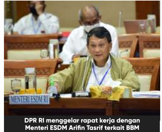
DPR RI menggelar rapat kerja dengan Menteri ESDM Arifin Tasrif terkait BBM

Ditambah lagi dia menilai meski harga minyak mentah murah, Pertamina juga masih terbebani untuk memberikan subsidi. "Prinsipnya terkait harga BBM, saat ini sudah ada peningkatan MOPS kemudian Brent Internasional. Siklus daripada crude internasional sering cepat sekali cyclenya,