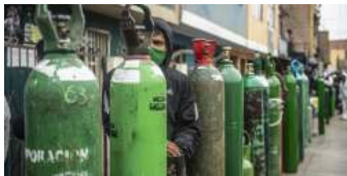
Kelangkaan tabung oksigen landa Peru di tengah pandemi corona

Jakarta-Kasus virus Corona COVID-19 terus meningkat dengan cepat, mendekati 10 juta kasus secara global. Dua krisis besar pun menghadang semua negara yang mengalami pandemi ini, yaitu krisis ekonomi dan oksigen.