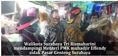
Walikota Surabaya Tri Rismaharini mendampingi Menteri PMK Muhadjir Effendy sidak Pasar Genteng Surabaya

Surabaya - Menko Pembangunan Manusia dan Kebudayaan (PMK), Muhadjir Effendy memberi beberapa catatan dan saran terkait penerapan protokol kesehatan di Pasar Genteng Surabaya. Pengetatan jumlah pengunjung hingga penambahan sekat antara pedagang dan pembeli perlu segera dilakukan.