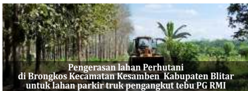
Pengerasan lahan Perhutani di Brongkos Kecamatan Kesamben Kabupaten Blitar untuk lahan parkir truk pengangkut tebu PG RMI

Selain itu, menurut peneliti ekonomi Indef Bhima Yudhistira redenominasi bisa mempengaruhi penghitungan akuntansi dan administrasi puluhan juta perusahaan. "Momentum pemulihan ekonomi sebaiknya jangan ada kebijakan yang kontraproduktif. Penyesuaian terhadap nominal baru akan mempengaruhi administrasi dan akuntansi puluhan juta perusahaan di Indonesia. UMKM saja ada 62 juta unit usaha," ungkapnya. "Alih-alih mau pemulihan ekonomi, mereka sibuk mengatur soal nominal harga di barang yang dijual, bahan baku bahkan administrasi perpajakan," sambungnya. (ist)