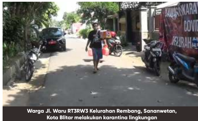
Warga Jl. Waru RT3RW3 Kelurahan Rembang, Sananwetan, Kota Blitar melakukan karantina lingkungan

Pantauan di lokasi, kondisi di lingkungan tersebut terlihat sepi. Jalan masuk lingkungan ditutup portal, rumah warga juga banyak yang tertutup karena mayoritas warga beraktivitas di dalam rumah.