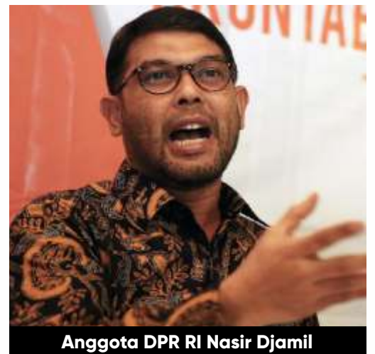
Anggota DPR RI Nasir Djamil

Dalam hal ini, anggota Komisi III lainnya, Arteria Dahlan meminta Jaksa Agung ST Burhanuddin menjerat seluruh pe-