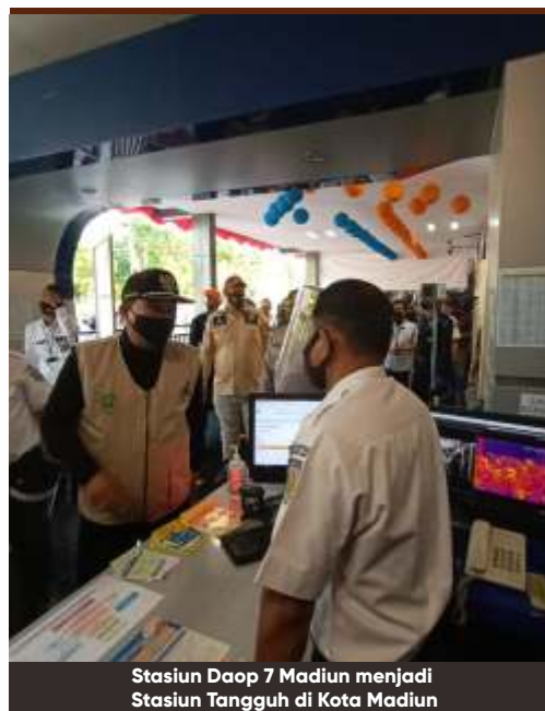
Stasiun Daop 7 Madiun menjadi Stasiun Tangguh di Kota Madiun

"Saat ini sudah ada 17 Tangguh yang masuk kategori antara lain, Kelurahan Tangguh, Perumahan Tangguh, Stasiun Tangguh, Patroli Tangguh, Mobil Tangguh dan