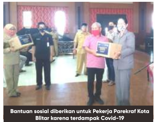
Bantuan sosial diberikan untuk Pekerja Parekraf Kota Blitar karena terdampak Covid-19

Pembagian bansos ini, juga dibantu oleh personil TNI-Polri yaitu Polres Blitar Kota dan Kodim 0808 Blitar sebanyak 275