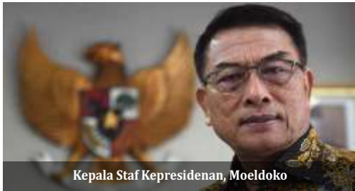
Kepala Staf Kepresidenan, Moeldoko

Jakarta - Presiden Joko Widodo (Jokowi) berencana membubarkan 18 komisi dan lembaga pemerintah demi menghemat anggaran pemerintah. Kepala Staf Kepresidenan (KSP) Moeldoko pun memberikan sedikit bocorannya.