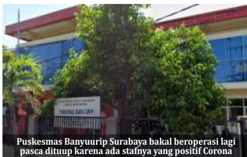
Puskesmas Banyu Urip Surabaya bakal beroperasi lagi pasca dituup karena ada stafnya yang positif Corona

Sebelumnya beredar sebuah pesan berantai di layanan percakapan whatsapp