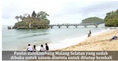
Pantai Balekambang Malang Selatan yang sudah dibuka untuk umum diminta untuk ditutup kembali

Dalam rapat itu, lanjut Made, turut hadir Muspika di sepanjang JLS. Mereka kemudian menyampaikan banyak menerima protes