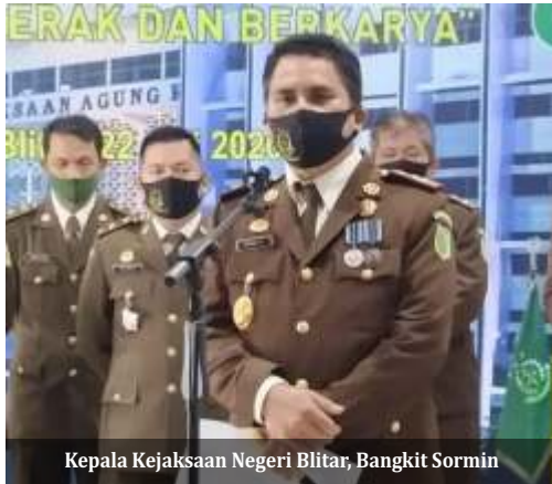
Kepala Kejaksaan Negeri Blitar, Bangkit Sormin

B litar - Kejaksaan Negeri Blitar melalui Tim Khusus dari Pidsus, berhasil menyelamatkan Dana Covid-19 sebesar Rp 2,3 miliar di Dinas Kesehatan Kabupaten Blitar. Hal tersebut disampaikan Kepala Kejaksaan Negeri Blitar, Bangkit Sormin.