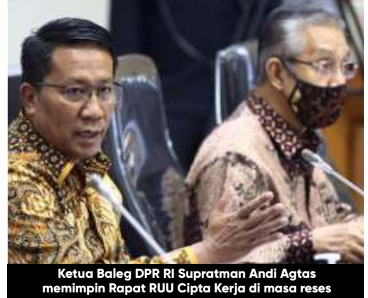
Ketua Baleg DPR RI Supratman Andi Agtas memimpin Rapat RUU Cipta Kerja di masa reses

Keberadaan RUU Omnibus Law Ciptaker sendiri telah ditentang sejumlah elemen masyarakat. Konfederasi Serikat Buruh Internasional (International Trade Union Confederation/ITUC) Asia