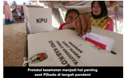
Protokol kesehatan menjadi hal penting saat Pilkada di tengah pandemi

"Khusus tentang pelayanan tentang hak pilih hari-H itu KPU kabupaten akan berkoordinasi dengan dinas kesehatan dengan gugus tugas untuk mendapatkan data berapa orang di wilayahnya yang misalnya dirawat di RS rujukan yang melakukan isolasi atau karantina secara mandiri itu kan diberikan datanya, lalu kabupaten/kota ini berkoordinasi dengan TPS mendistribusikan data itu ke masing-masing petugas TPS, sehingga memudahkan dalam pelaksanaan hak pilihnya," jelas