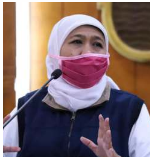
Gubernur Jatim, Khofifah Indarparawansa

"Jangan bahagia berlebihan sehingga lupa kalau Jatim masih dalam situasi darurat dan semua berpotensi tertular dan menularkan. Pokoknya tetap waspada