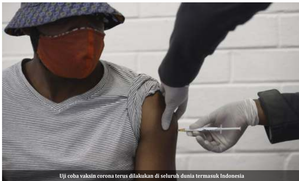
Uji coba vaksin corona terus dilakukan di seluruh dunia termasuk Indonesia

Ketiga, adalah kandidat vaksin virus corona yang dihasilkan oleh developer Beijing Institute of Biological Products/Sinopharm. Vaksin ini menggunakan platform inactivated dengan target virus SARS-CoV2. Selain vaksin yang sudah menjalani uji klinis fase 3, Beijing Institute of Biological Products/Sinopharm juga tengah