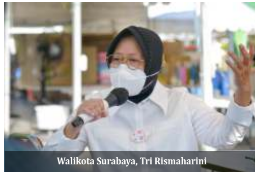
Walikota Surabaya, Tri Rismaharini

Menurutnya, pembentukan tim ini dinilai penting untuk saling berkoordinasi dan menyamakan persepsi. Selain itu agar semua pihak yang selama ini telah berjalan bersama, tetap memiliki satu tujuan. Misalnya dalam memutuskan suatu protokol kesehatan di