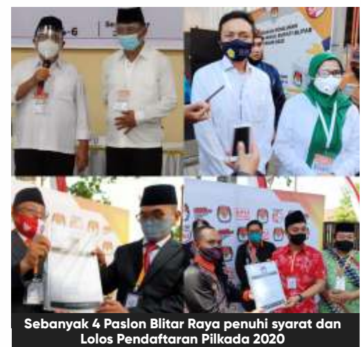
Sebanyak 4 Paslon Blitar Raya penuh syarat dan Lolos Pendaftaran Pilkada 2020