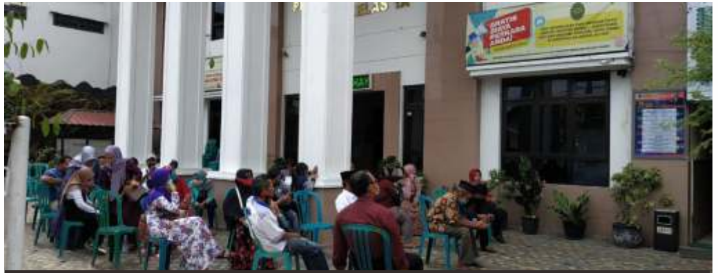
Antrean pasangan yang mengajukan cerai di Pengadilan Agama (PA) Blitar

Adapun data perkara perceraian yang ditangani PA Blitar sesuai kewenangannya selama 2020 : Januari 632 perkara, Pebruari 444 perkara, Maret 352 perkara, April 303 perkara, Mei puncak saat PSBB hanya 154 perkara. "Setelah PSBB, kembali naik setiap bulannya mencapai 400 perkara," paparnya.