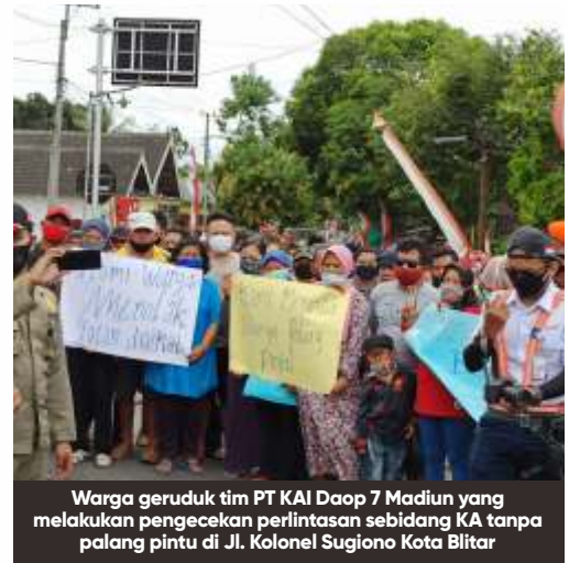
Warga geruduk tim PT KAI Daop 7 Madiun yang melakukan pengecekan perlintasan sebidang KA tanpa palang pintu di Jl. Kolonel Sugiono Kota Blitar