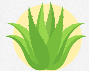
Gel lidah buaya

Tak semua masalah rambut dan kecantikan harus diatasi dengan bahan kimia. Banyak bahan alami yang juga ampuh menjadi solusinya. Misalnya untuk rambut berketombe, seperti dikutip Boldsy, berikut ini berbagai bahan untuk mengatasi masalah rambut tersebut.