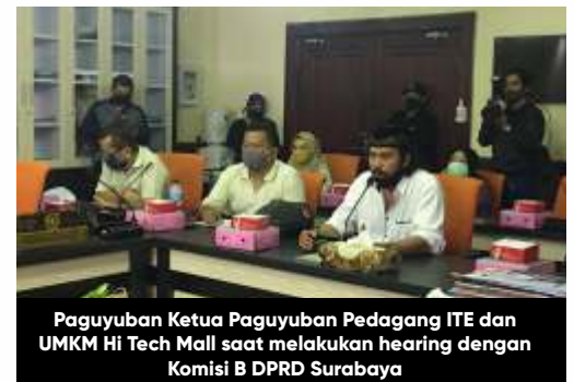
Paguyuban Ketua Paguyuban Pedagang ITE dan UMKM Hi Tech Mall saat melakukan hearing dengan Komisi B DPRD Surabaya