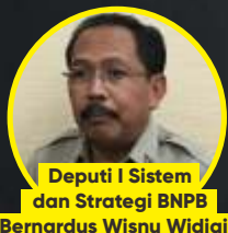
Deputi I Sistem dan Strategi BNPB Bernardus Wisnu Widjaja

"Kandidat calon kepala daerah berpotensi melanggar protokol kesehatan bila KPU tetap memperbolehkan acara konser musik dalam tahapan kampanye Pilkada. Harusnya diimbau agar para kandidat tak menggelar konser saat kampanye terbuka berlangsung meski diperbolehkan oleh peraturan."