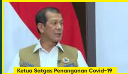
Ketua Satgas Penanganan Covid-19 Doni Monardo

Melihat kebutuhan itu DPR RI mendorong pemerintah menyeragamkan harga tes usap (swab test) dengan metode poly-merase chain reaction (PCR) untuk mendeteksi Covid-19. Keseragaman harga ini bertujuan agar seluruh lapisan masyarakat mendapatkan akses yang sama.