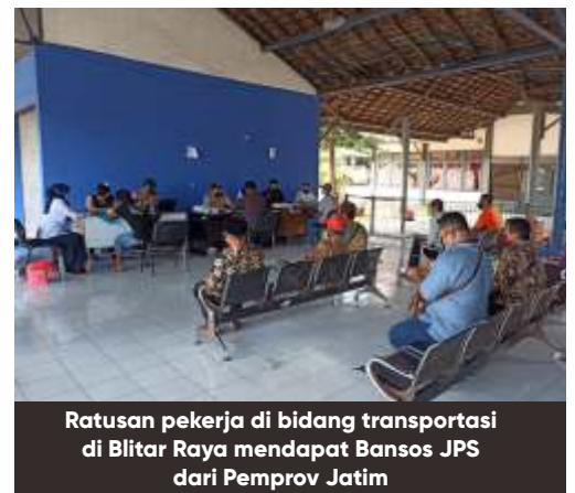
Ratusan pekerja di bidang transportasi di Blitar Raya mendapat Bansos JPS dari Pemprov Jatim