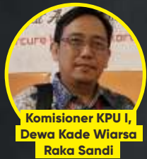
Komisioner KPU I, Dewa Kade Wiarsa Raka Sandi

Di tengah kasus pandemi Covid-19 di Indonesia yang mlesat makin kencang, Komisi Pemilihan Umum (KPU) malah memberi 'lampu hijau' konser musik saat kampanye Pilkada 2020. Hal itu diatur dalam pasal 63 ayat (1) PKPU Nomor 10 Tahun 2020. Keputusan itupun langsung mendapat protes dari berbagai pihak. Sebab, kegiatan yang mengumpulkan massa secara otomatis melanggar protokol kesehatan dan dilarang oleh pemerintah. Piye tho!