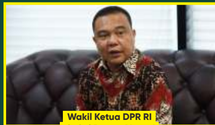
Wakil Ketua DPR RI Sufmi Dasco Ahmad

"Ada RS yang mematok harga tes PCR swab sampai di atas Rp 2,5 juta, padahal harga rutin atau harga yang bisa kita lihat sebenarnya tidak akan lebih dari Rp 500.000 per pemeriksaan specimen. Supaya harganya standar, kami tidak ingin pengusaha yang membeli alat, membangun jaringan, mereka rugi, tapi kami juga tidak ingin masyarakat mengalami kerugian. Jadi kami akan libatkan BPKP untuk memutuskan harga yang layak sehingga berjalan dengan baik."