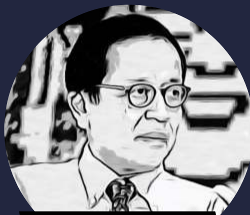
Kepala PPATK, Dian Ediana Rae

Secara keseluruhan, ada 19 bank yang tercatat telah melakukan transaksi janggal terekam dalam dokumen FinCEN Files terjadi di Indonesia. Total jumlah transaksi tersebut sebanyak 496 transaksi yang terekam sejak Februari 2013 hingga 3 Juli 2017. Transaksi tersebut diproses melalui empat bank yang berbasis di Amerika Serikat, yakni The Bank of New York Mellon sebanyak 312 transaksi, Deutsche Bank AG 49