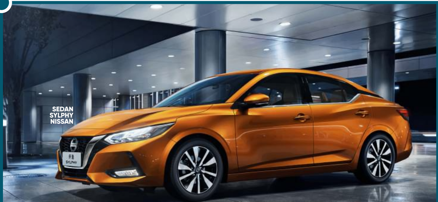
SEDAN SYLPHY NISSAN