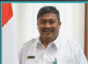
DIREKTUR JENDERAL HORTIKULTURA PRIHASTO SETYANTO

"Kami belum memiliki data atas dugaan impor bawang putih tanpa adanya SPI. Meski demikian, memang adabeberapa kasus impor bawang putih berkategori ilegal. selama ini juga masih terdapat kasus SPI diberikan kepada importir yang tidak memenuhi ketentuan. Di sisi lain, ada juga perusahaan yang sudah menjalankan kewajiban, tapi tidak kunjung mendapatkan SPI."