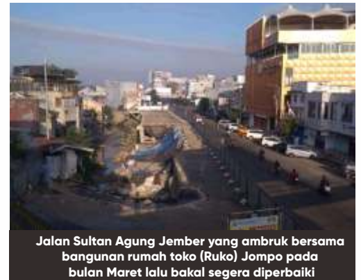
Jalan Sultan Agung Jember yang ambruk bersama bangunan rumah toko (Ruko) Jompo pada bulan Maret lalu bakal segera diperbaiki

Jalan Raya Sultan Agung di Kabupaten Jember, Jawa Timur, sempat ditutup total, Senin (2/3/2020), menyusul ambrolnya salah satu titik di jalan tersebut. Jalan Sultan Agung adalah jalan nasional dan salah satu jalan protokol di Jember. Jalan tersebut ambrol pada pukul 04.15 WIB dan membuat sepuluh rumah toko ikut amblas ke dalam sungai yang berada di