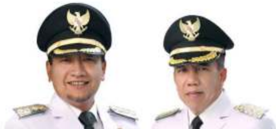
H.M. Irsyad Yusuf, SE. MMA Bupati Pasuruan

semoga tetap menjadi media yang independen dan kredibel dalam memperjuangkan kepentingan masyarakat dan selalu mendapat berkah dari Allah SWT