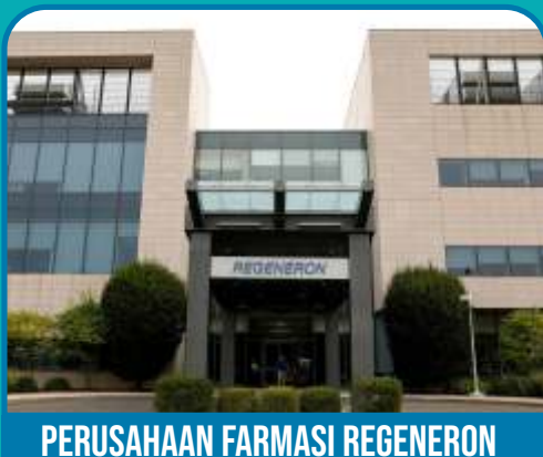
PERUSAHAAN FARMASI REGENERON

Para ilmuwan Regeneron mengevaluasi ribuan antibodi yang dipanen dari tikus yang dimodifikasi secara genetik dan dari manusia, mengidentifikasi dua antibodi yang mereka temukan paling kuat melawan virus SARS-CoV-2, sementara tidak saling bersaing (Ist).