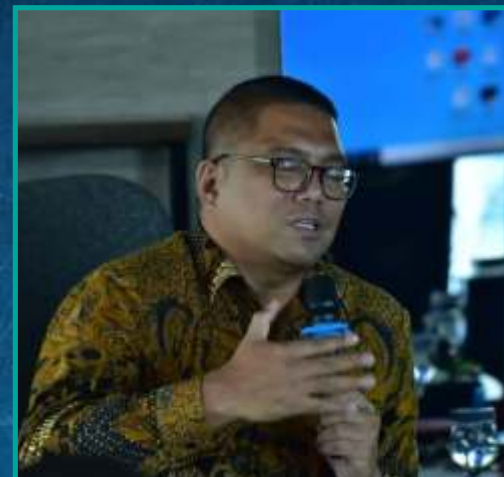
Anggota Bawaslu RI, Fritz Edward Siregar

KPU juga mewajibkan kandidat mengunggah konten sesuai aturan selama masa kampanye. Selain itu kandidat wajib melapor ke KPU dan Bawaslu sebelum menyebarkan pesan di media sosial ataupun iklan di media massa. Khusus pilkada kali ini, paslon tak perlu menghapus akun media