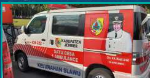
Foto Faida di 248 ambulans desa ditutup logo Pemkab Jember jelang Pilkada 2020

Muqit menambahkan penutupan gambar petahana tidak hanya dilakukan di ambulans desa, tetapi juga di fasilitas milik negara lainnya, seperti bus perpustakaan. Sementara itu, anggota Bawaslu Jember Divisi Hukum