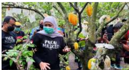
Gubernur Khofifah kunjungi Agro Wisata Belimbing di Kelurahan Karang Sari, Kecamatan Sukorejo, Kota Blitar

Untuk menjaga kualitas itu, diharapkan quantity dan continuity (kuantitas dan kesinambungan), buah belimbing juga bisa terjaga. "Bibit-bibit unggulan dari Kota Blitar,