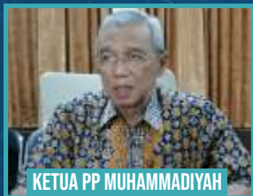
KETUA PP MUHAMMADIYAH BUSYRO MUQODDAS

"Ada kajian kita bahwa biaya-biaya pilkada itu lebih besar dari harta yang dimiliki oleh para calon. Kenapa kita tahu? karena setiap calon harus melaporkan laporan harta kekayaannya. LHKPN kita terima, tapi kita hitung-hitung berapa biaya mereka melakukan pelaksanaan Pilkada. Ternyata lebih besar dari jumlah kekayaannya. Kita tanya dari mana datangnya dana? datangnya adalah dari kalangan swasta. Kenapa itu terjadi? karena para swasta mendapatkan kesempatan baik itu pekerjaan, fasilitas, untuk mendapatkan keuntungan."