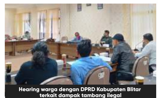
Hearing warga dengan DPRD Kabupaten Blitar terkait dampak tambang ilegal

Oleh karena itu, pihaknya meminta bantuan dewan agar menindaklanjuti dan mendesak Pemkab Blitar untuk menertibkan penambangan liar, serta membuat Peraturan Daerah (Perda)