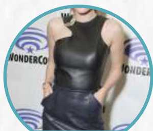
LEATHER TOP MINI DRESS

Nah kalo yang satu ini cocok banget nih dikenakan buat kamu yang mau tampil feminin tapi tetap sederhana! Karena kamu bisa kenakan atasan kaos polos, blouse atau baju rajutan favorit kamu, lalu lapis dengan leather top mini dress. Dijamin penampilan kamu bakal terlihat cantik dan imut!