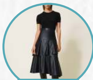
FAUX-LEATHER MIDI SKIRT

Nah kalo yang satu ini cocok banget nih dikenakan buat kamu yang mau tampil feminin tapi tetap sederhana! Karena kamu bisa kenakan atasan kaos polos, blouse atau baju rajutan favorit kamu, lalu lapis dengan leather top mini dress. Dijamin penampilan kamu bakal terlihat cantik dan imut!