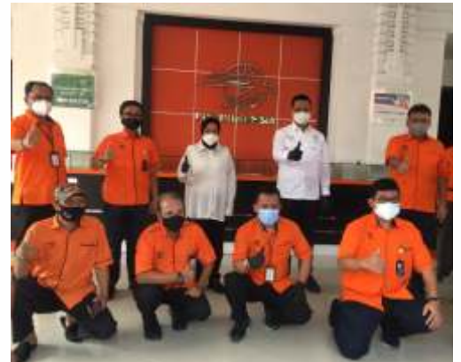
Mensos Juliari P Batubara dan Walikota Surabaya, Tri Rismaharini saat Penyaluran BST di Kantor Pos Kebon Rejo Kota Surabaya, Rabu (7/10).

Mendapati hal itu, Risma kemudian mengeluh kepada Mensos agar bisa dinaikkan jumlah penerima manfaat BST. Hal itu dikarenakan jumlah penerima BST saat itu