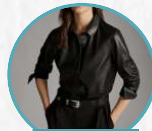
BLACK LEATHER SHIRT

Midi skirt panjang seperti ini biasanya dibuat dari faux-leather yang lembut sehingga membuat kamu nyaman saat mengenakannya. Kamu bisa mengombinasikan outfit dengan kaos dan jaket denim atau blazer yang ditambahkan dengan aksesoris.