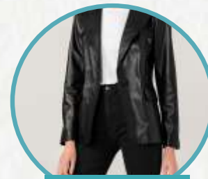
BLACK LEATHER BLAZER

Kali ini coba ganti celana jogging katun kamu dengan faux-leather elastic waist pants! Karena enggak hanya tampil sporty, dengan celana jenis ini kamu juga akan tampil keren saat berpergian! Kamu cukup kombinasikan dengan sweatshirt polos dan sepatu sport atau sepatu boots berwarna hitam!