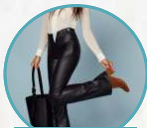
LEATHER BOOTSCUT PANTS

Buat kalian yang bosan sama kemeja dengan bahan satin silk atau katun, bisa banget nih coba pake bahan kulit seperti yang satu ini. Tampil dengan black leather shirt tetap akan membuat kamu tampil cantik! Kamu bisa gunakan black leather shirt oversized agar tampilan kamu makin kece.