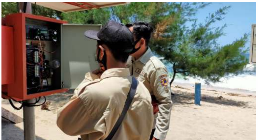
BPBD Kabupaten Blitar mengecek alat Early Warning System (EWS) dalam sosialisasi mitigasi bencana tsunami di pesisir selatan

Adapun dampak adanya potensi bencana tsunami di Kabupaten Blitar, terjadi pada 12 desa di 4 kecamatan. Yaitu di Kecamatan Wates, Panggungrejo, Wonotirto dan Bakung. "Seperti di Pantai Tambakrejo ini, luas wilayah