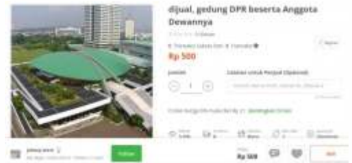
Diduga terkait protes pengesahan UU Cipta Kerja, gedung DPR RI 'dijual' oknum di toko online

Anies mencontohkan, ketika ada pejabat Balai Kota DKI Jakarta kena Corona, tidak dilakukan penutupan seluruh gedung. Hanya blok G saja yang ditutup. "Jadi tidak ditutup seluruh kompleks, tapi yang ditutup di gedung-gedung dimana di situ ditemukan orang yang positif. Jadi gedung tempat orang bekerja positif, di situ yang ditutup. Kalau tidak (ditemukan yang positif), ya tidak (ditutup gedungnya)," imbuh Anies. (ist)