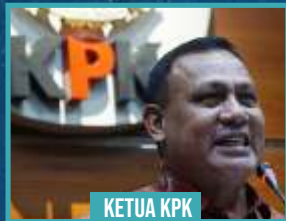
KETUA KPK FIRLI BAHURI

"Ada kajian kita bahwa biaya-biaya pilkada itu lebih besar dari harta yang dimiliki oleh para calon. Kenapa kita tahu? karena setiap calon harus melaporkan laporan harta kekayaannya. LHKPN kita terima, tapi kita hitung-hitung berapa biaya mereka melakukan pelaksanaan Pilkada. Ternyata lebih besar dari jumlah kekayaannya. Kita tanya dari mana datangnya dana? datangnya adalah dari kalangan swasta. Kenapa itu terjadi? karena para swasta mendapatkan kesempatan baik itu pekerjaan, fasilitas, untuk mendapatkan keuntungan."