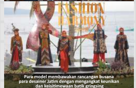
Para model membawakan rancangan busana para desainer Jatim dengan mengangkat keunikan dan keistimewaan batik gringsing