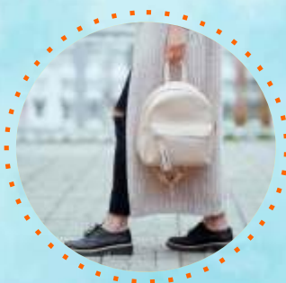
ATURAN PAKAI SEPATU

Salah satu hal terpenting yang harus diingat adalah jangan terlalu sering menggosok karena akan merusak pelindung kulit. Selalu pastikan bahwa kamu melakukan pengelupasan kulit diikuti dengan penggunaan pelembab yang baik. Langkah ini sangat penting untuk menjaga kulit tetap terhidrasi dan sehat.