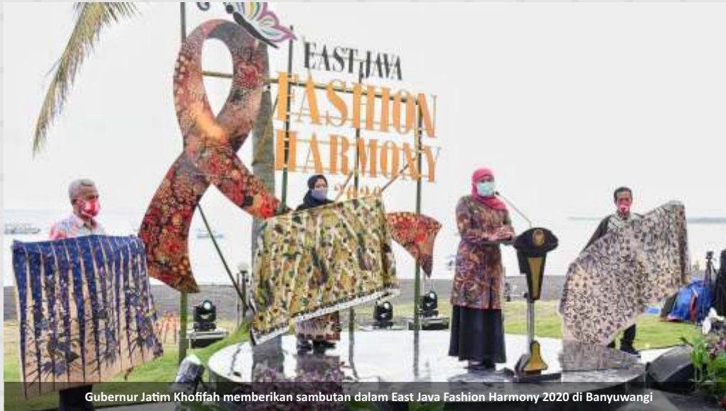
Gubernur Jatim Khofifah memberikan sambutan dalam East Java Fashion Harmony 2020 di Banyuwangi

B anyuwangi- East Java Fashion Harmony 2020 berlangsung bersahaja dan indah. Digelar dengan berlatar belakang Pantai So Long Banyuwangi, Sabtu (14/11), fashion show bertema Batik Gringsing ini dihelat dengan menyulap kawasan Villa So Long menjadi catwalk para model.