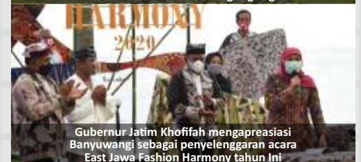
Gubernur Jatim Khofifah mengapresiasi Banyuwangi sebagai penyelenggara acara East Java Fashion Harmony tahun ini