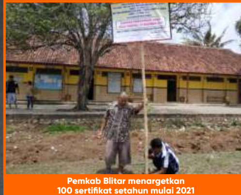
Pemkab Blitar menargetkan 100 sertifikat setahun mulai 2021

menjadi pantauan KPK, karena aset daerah terutama tanah kalau belum bersertifikat akan jadi masalah kalau tidak diurus. Ada beberapa kasus, aset daerah yang diklaim oleh masyarakat. "Jadi harus jelas statusnya, disertai bukti-bukti yang kuat lalu segera diurus sertifikatnya supaya jelas status hukumnya," tandasnya.