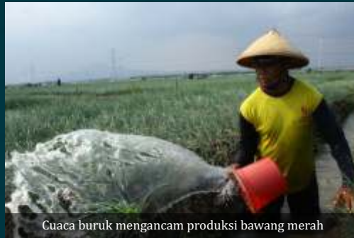
Cuaca buruk mengancam produksi bawang merah