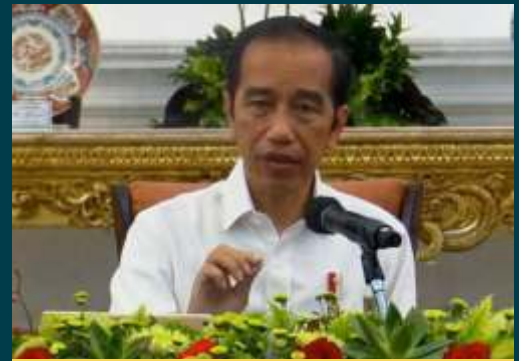
Presiden Indonesia, Joko Widodo

Lebih lanjut, Jokowi meminta Komite dan Satgas Penanganan Covid-19 untuk terus waspada. Strategi 'gas dan rem' penanganan pandemi dalam sektor kesehatan dan ekonomi harus diatur dengan baik. Jokowi mengingatkan, jangan sampai upaya tersebut mengendur sehingga terjadi pandemi gelombang kedua. "Jadi strategi yang sejak awal kita sampaikan rem dan gas itu betul-betul diatur betul, jangan sampai kendur dan juga memunculkan risiko gelombang kedua, ini yang bisa membuat kita set back, mundur lagi," ucapnya.