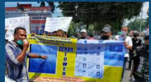
Puluhan warga Jl. Melati Gang II Kota Blitar menggeruduk Kantor DPRD dan Pemkot menolak pembangunan Tower Seluler

Aksi penolakan dilanjutkan dengan mendatangi Kantor Walikota Blitar di Jl. Merdeka, warga ditemui oleh Sekkota Blitar,