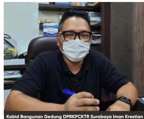
Kabid Bangunan Gedung DPRKPKTR Surabaya Iman Krestian

Sementara pembangunan RSUD Dr M Soewandhie sempat terhenti selama sekitar tiga bulan karena terdampak pandemi Covid-19. Selain terkait dana, ada larangan pekerja proyek berkumpul serta pembatasan material yang akhirnya tidak bisa