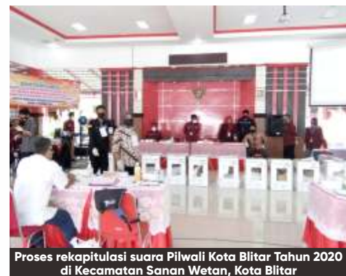
Proses rekapitulasi suara Pilwali Kota Blitar Tahun 2020 di Kecamatan Sanan Wetan, Kota Blitar

Kemudian ada 11 daerah lainnya di Jatim, yang tingkat parnasnya meningkat tapi