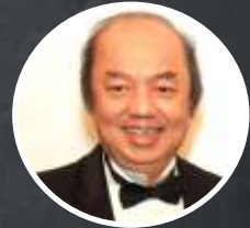
10. SRI DATO TAHIR US$ 3,3 miliar atau setara Rp 46,53 triliun