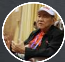
1. BUDI & MICHAEL HARTONO US$ 38,8 miliar atau setara Rp 547,8 triliun.