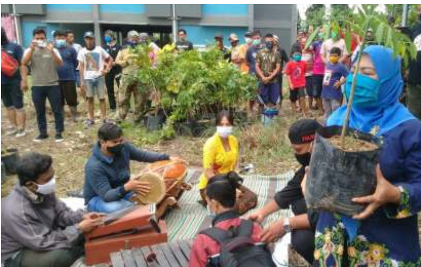
Satpol PP Pemprov Jatim bersama masyarakat peduli lingkungan menggelar Ritual Tanam Sambut Hujan, di Rusunawa Sumur Welut, Jalan Sumberan, Kecamatan Lakarsantri, Kota Surabaya, Minggu (13/12).

"Saya minta nanti identifikasi tanaman apa saja yang cocok di sini serta hasilnya bisa dikelola dengan arah penguatan ekonomi. Pengembangan UMKM, gotong royong dan ternak lele sudah mulai muncul, Bank sampah