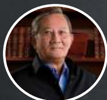
6. SUSILO WONOWIDJOJO US$ 5,3 miliar atau setara Rp 74,73 triliun