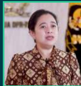
Ketua DPR RI Puan Maharani

"Upaya menangani pandemi Covid-19 dan dampaknya, tidak dapat dilakukan secara cepat karena itu dirinya mengajak seluruh anggota DPR membangun optimisme masyarakat dalam mengatasi masalah pandemi tersebut."