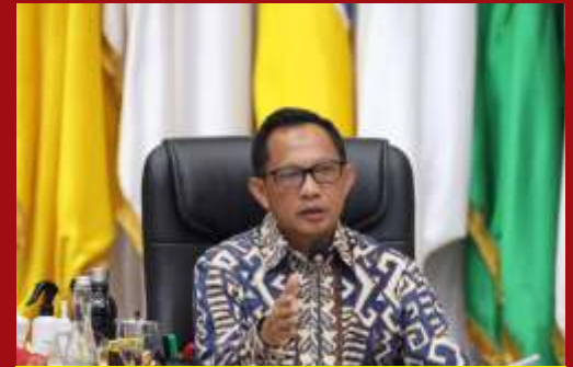
Mendagri, Tito Karnavian

gelar umumnya karena masa jabatan yang habis, mundur atas permintaan sendiri, diberhentikan karena kasus hukum atau masalah-masalah lain. Seperti diketahui masa jabatan seorang kepala daerah adalah 6 tahun.