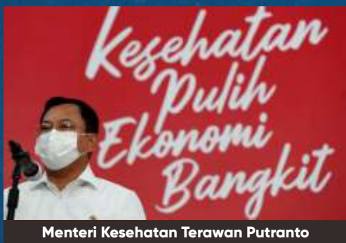
Menteri Kesehatan Terawan Putranto

Terawan menyebut 35 juta orang yang masuk dalam program pemerintah untuk dibiayai vaksin COVID merupakan tenaga kesehatan, pelayan publik dan kelompok masyarakat rentan miskin atau tertular. Skema realisasi vaksinasi akan disesuaikan dengan sistem satu data yang terintegrasi yang saat ini tengah dimatangkan oleh Kementerian BUMN, Kementerian Kesehatan