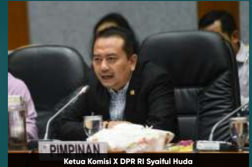
Ketua Komisi X DPR RI Syaiful Huda

Menurut Bima, PPPK dan PNS setara dari segi jabatan. Perbedaan kedua aparatur sipil negara (ASN) itu hanya soal ada atau