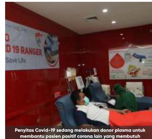
Penyintas Covid-19 sedang melakukan donor plasma untuk membantu pasien positif corona lain yang membutuhkan

"Keberadaan para penyintas Covid-19 juga sangat berarti, berkenaan dengan potensi mereka sebagai pendonor. Untuk layanan donor plasma darah konvalesen, karena RSUD Dr Soetomo juga merupakan