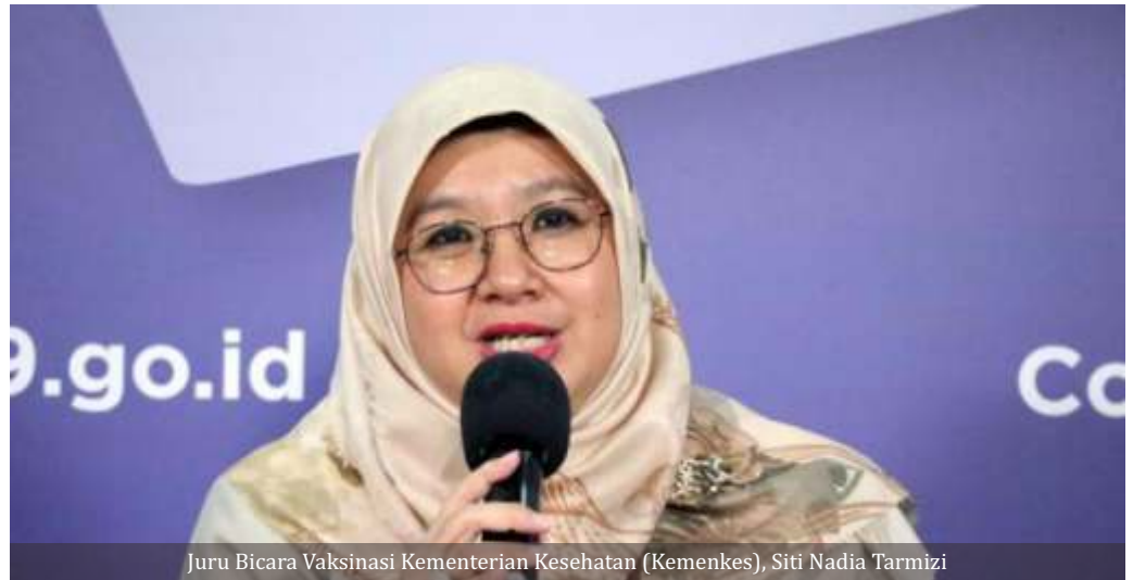
Juru Bicara Vaksinasi Kementerian Kesehatan (Kemenkes), Siti Nadia Tarmizi

Tercatat pada hari ini, Minggu (3/1) ada penambahan kasus positif sebanyak 6.877 orang. Dengan tambahan itu kini jumlah kasus positif mencapai 765.350 orang. Selain mengumumkan jumlah kasus positif, Kemenkes juga mengumumkan ada tambahan pasien sembuh sebanyak 6.419 orang. Sehingga kini total pasien sembuh ada 631.937 orang. Kemenkes juga memperbaharui data pasien meninggal akibat COVID-19. Hari ini ada tambahan 174 pasien